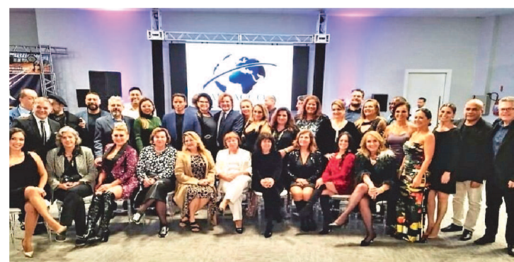
DIRETORIA DA ABRACCOS E ASSOCIADOS