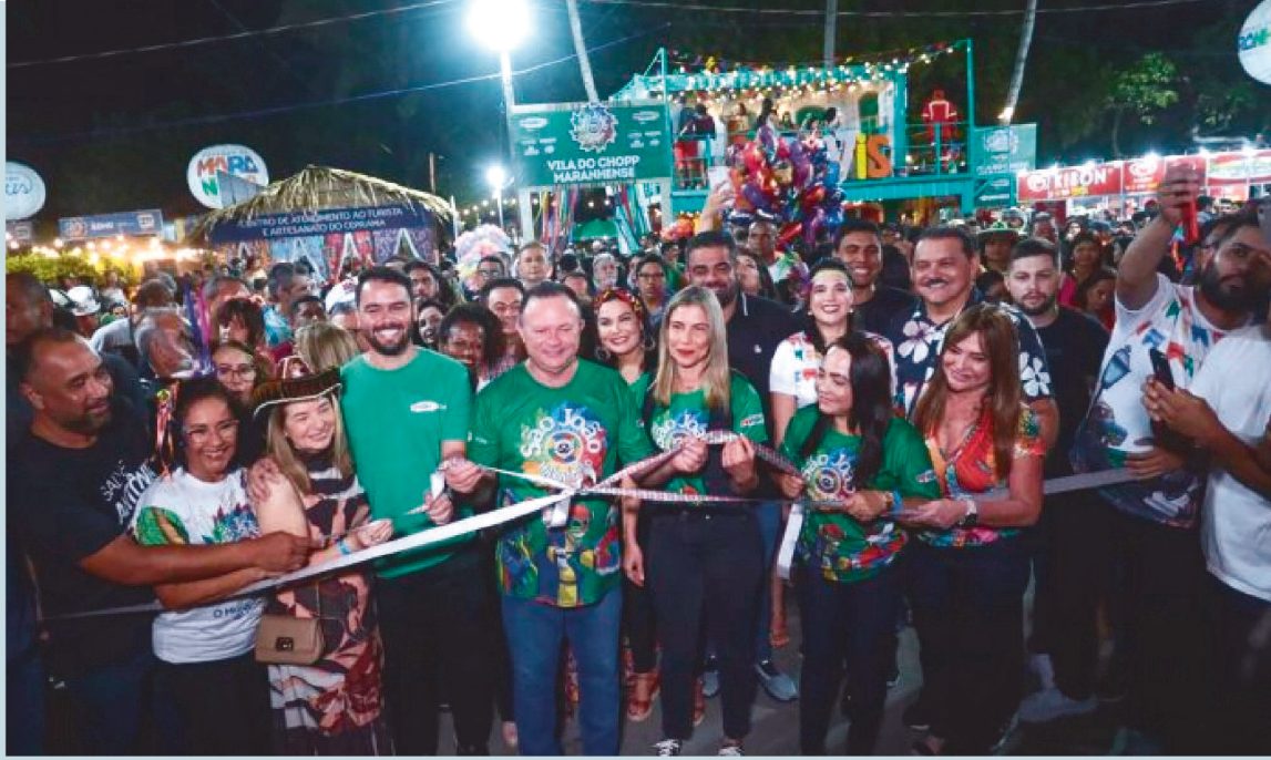
Ao lado da primeira dama Larissa Brandão, secretários de Estado, entre outras autoridades, governador Carlos Brandão corta a fita na porta do Arraial do Ipem e declara aberta a temporada 2023 do São João do Maranhão