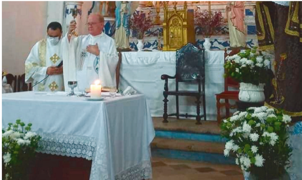
O PONTO ALTO DO FESTEJO É NO DIA 13 DE JUNHO, COMEMORADO O DIA DO SANTO

Neste dia 6 (terça-feira), o Largo Cultural terá as apresentações do Tambor de Crioula Maracrioula e do Boi Novilho Branco. No dia 7, tem os