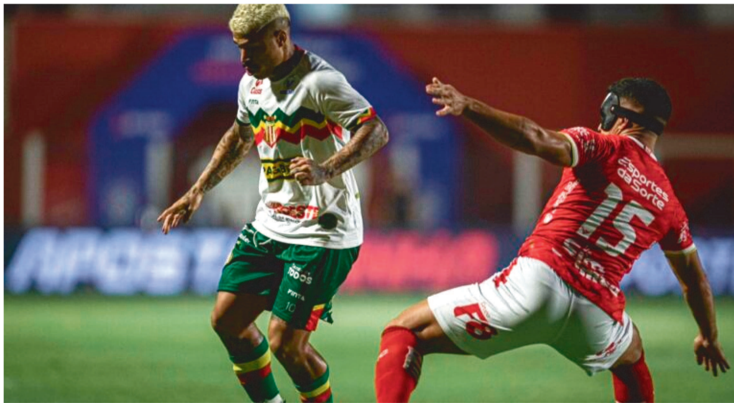
SAMPAIO CORRÊA VEM DE DERROTA PARA O VILA NOVA POR 3 X 0, FORA DE CASA, PELA SÉRIE B DO CAMPEONATO BRASILEIRO

Jogadores e comissão técnica do Sampaio Corrêa já esqueceram a derrota por 3 a 0 para o Vila Nova-GO, em Goiânia, no último sábado, às 19h, e agora só pensam no jogo desta quarta-feira (7), no Castelão, contra o Londrina. No fechamento da décima rodada, o Tricolor manteve-se no 12º lugar, sendo beneficiado pela derrota do próximo adversário paranaense para o Sport-PE (2 a 1), no último domingo. Ao perder para o Vila, no entanto, o Tricolor desperdiçou a oportunidade de se aproximar do pelotão dos dez primeiros colocados. Ficou