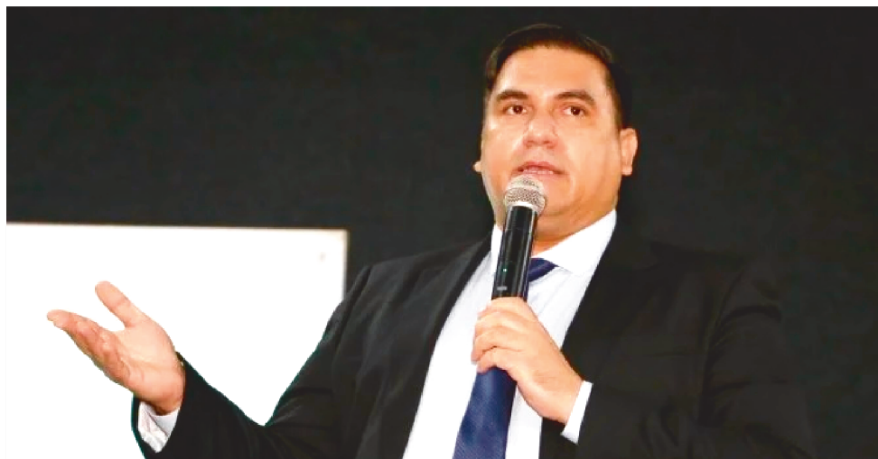
A DEMISSÃO FOI PUBLICADA NA EDIÇÃO DE ONTEM DO DIÁRIO OFICIAL DA UNIÃO (DOU)

da Operação Hefesto, que investiga fraudes na compra de kits de robótica para 46 municípios de Alagoas com recursos do Fundo Nacional de Desenvolvimento da Educação (FNDE). Esses crimes teriam ocorrido entre os anos de 2019 e 2022.