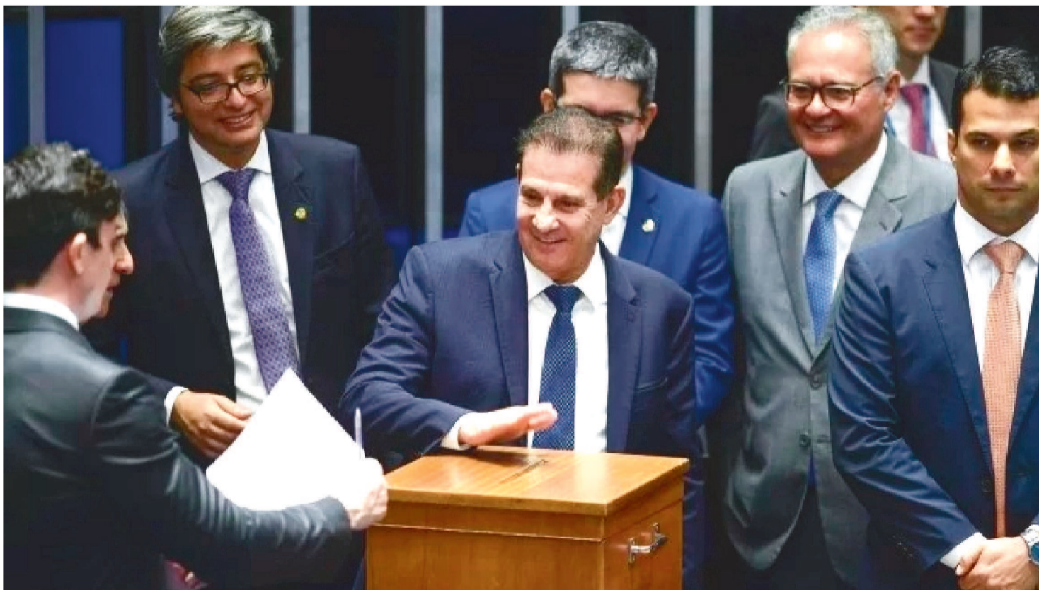
UM GRUPO DE TRABALHO SERÁ CRIADO DENTRO DA COMISSÃO DE ASSUNTOS ECONÔMICOS DO SENADO PARA DISCUTIR A PROPOSTA

O senador Vanderlan Cardoso (PSD-GO), presidente da Comissão de Assuntos Econômicos (CAE), anunciou nesta terça-feira (6), a criação de um grupo de trabalho (GT) dentro da CAE para analisar a reforma tributária. O pedido da criação do GT foi do próprio Vanderlan.