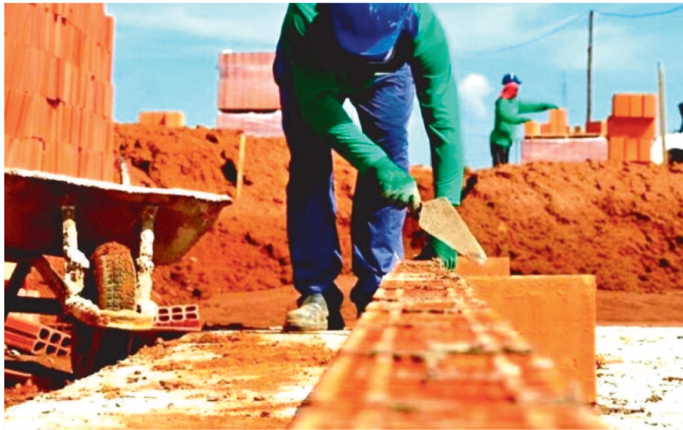
ENTRE OS DESTAQUES DE SALDO POSITIVO DE ABRIL ESTÁ A ÁREA DA CONSTRUÇÃO

A publicação aponta que algumas áreas tiveram destaque com exibição de saldo positivo no mês de abril. Fo-