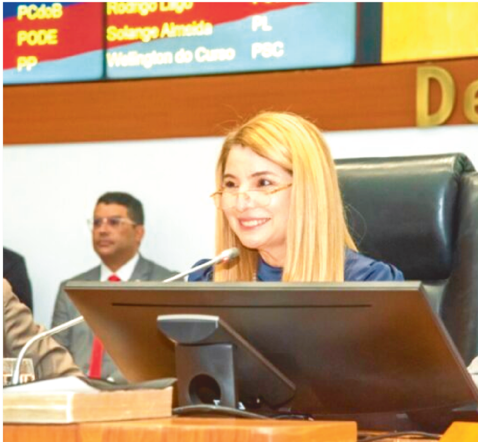
A PRESIDENTE DA ASSEMBLEIA LEGISLATIVA DO MARANHÃO, DEPUTADA IRACEMA (PSB)

A resolução altera a redação do art. 7º, do Regimento Interno (Resolução Legislativa nº 449/2004, de 24 de junho de 2004), alterado pelas Resoluções Legislativas nº 458/2004, 550/2008, 599/2010, 662/2012, 781/2016, 910/2018, 939/209 e 1.156/2022.