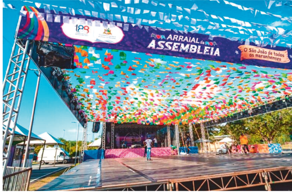
DURANTE AS QUATRO NOITES, PASSARÃO PELO PALCO GRANDES ATRAÇÕES JUNINAS

Durante as quatro noites, passarão pelo palco grandes atrações, incluindo também apresentações da Creche-Escola Sementinha e do Programa Sol Nascente. O roteiro destaca o Bumba Meu Boi de Maracanã, Boi Prenda de Cururupu, Boi de Morros, Boi de Nina