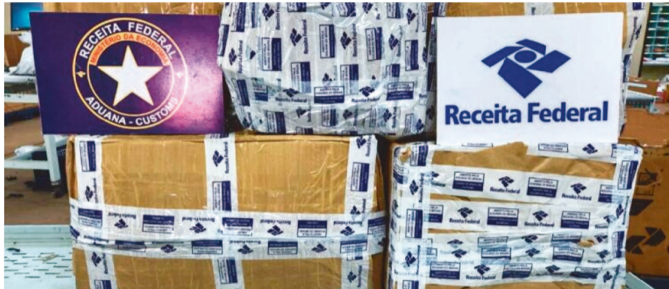
A RECEITA FEDERAL APREENDEU MAIS DE 27 QUILOS DE SKUNK (SUPERMACONHA)

Uma operação da Divisão de Vigilância e Repressão ao Contrabando e Descaminho da Receita Federal (Direp03), em Imperatriz (MA), realizada na manhã de hoje (15/06), apreendeu mais de 27 quilos de skunk. As encomendas estavam em um centro de distribuição dos Correios, com origem em São Paulo (SP) e destino a Balsas (MA). O valor total estimado da apreensão supera R$ 1 milhão.