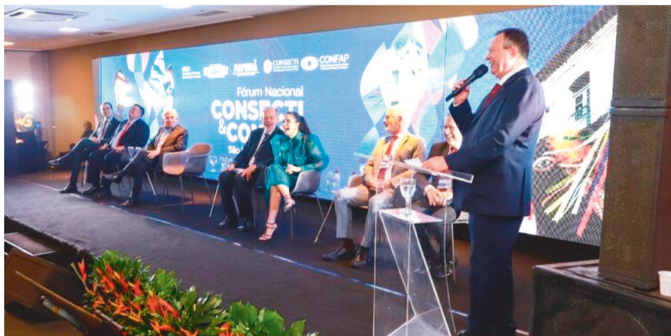
BRANDÃO ANUNCIOU REAJUSTE DURANTE DO FÓRUM NACIONAL CONSECTI & CONFAP

“Estamos avançando na criação de startups, em diversas edições interna-