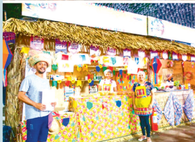
Turistas de todas as partes do Brasil vêm também a São Luís para prestigiar as comidas típicas maranhenses. Da culinária local, o vatapá, a torta de camarão e o arroz de cuxá, são os mais procurados