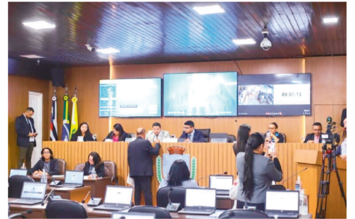
PEDIDOS FORAM FEITOS DURANTE AS ÚLTIMAS SESSÕES

Foram apresentadas, junto à Câmara de São Luís, seis solicitações de realização de obras nos bairros Coroadinho, Ivar Saldanha, Jordoá, Pirapora, Santa Júlia e São Bernardo.