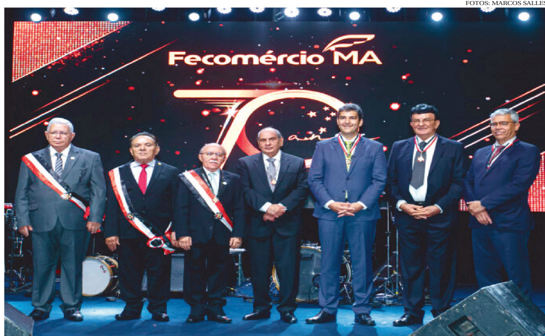
HOMENAGEADOS E DIRIGENTES DA FECOMÉRCIO-MA