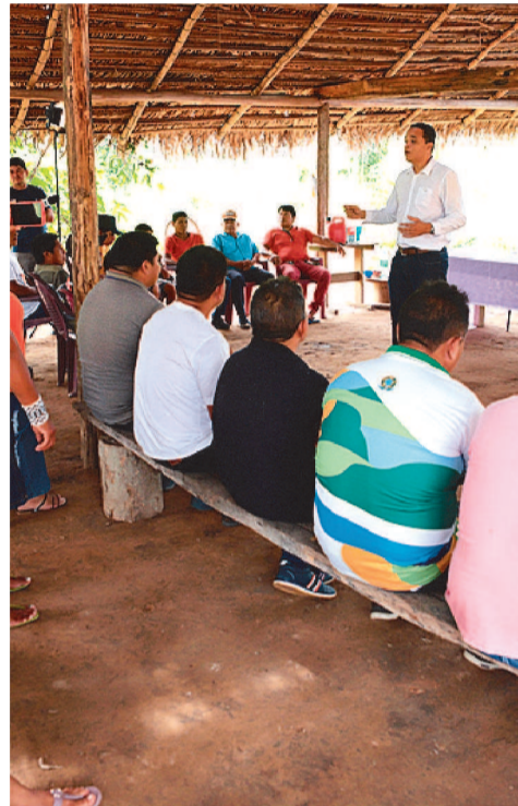
A programação da audiência conta

com duas mesas. A primeira delas está reservada para a fala dos movimentos sociais.