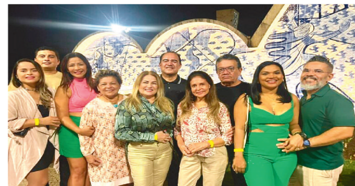
"A LIGA" DE SÃO LUÍS, CIRCOLOU POR BELO HORIZONTE-MG