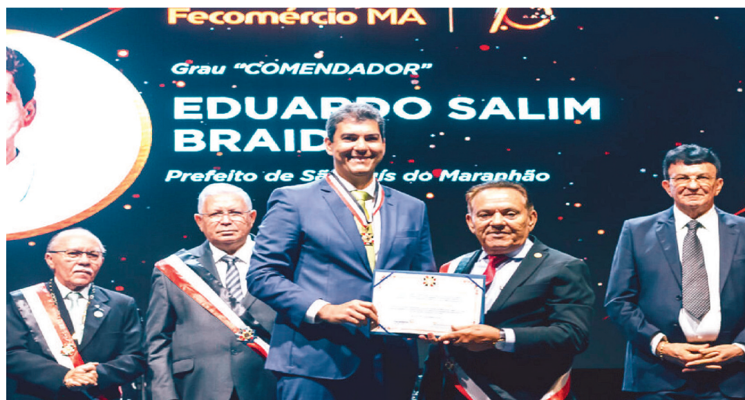
PREFEITO DE SÃO LUÍS, EDUARDO BRAIDE, RECEBENDO COMENDA