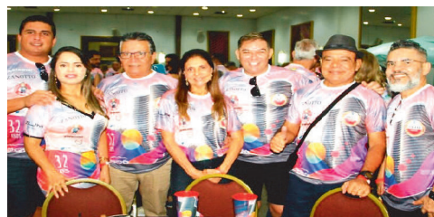
JORNALISTAS E AMIGOS DO MARANHÃO FORAM PRESTIGIAR O EVENTO

O evento reuniu jornalistas e convidados de São Luís, Fortaleza, Rio e