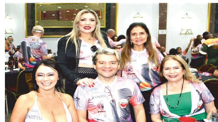
AMIGOS DO MARANHÃO EM BELO HORIZONTE-MG