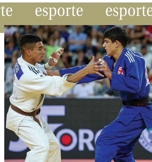
Maranhense fica em 5º no Mundial de Judô na Croácia