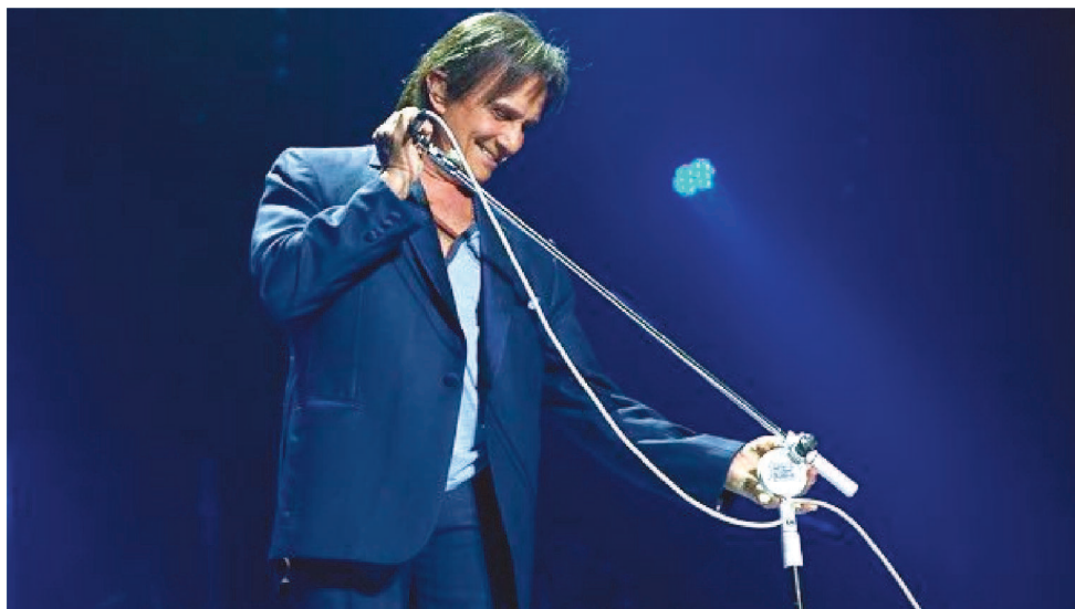
ROBERTO CARLOS ESTÁ NA LISTA DA GLOBAL CONCERT PULSE COMO UM DOS 30 ARTISTAS DE MAIOR PÚBLICO

da revista Global Concert Pulse como um dos 30 artistas de maior público nos Estados Unidos, ao lado de nomes como Elton John, Cher, a banda Kiss e outros grandes nomes da música mundial.