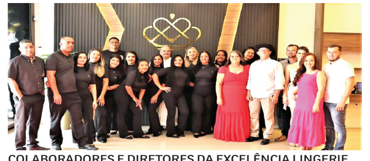
COLABORADORES E DIRETORES DA EXCELÊNCIA LINGERIE