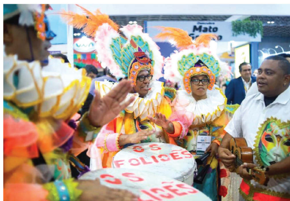
A cultura maranhense foi representada pelo bloco tradicional Os Foliões que se apresentou todos os dias da ABAV Expo no estande do "Maranhão de Encantos"