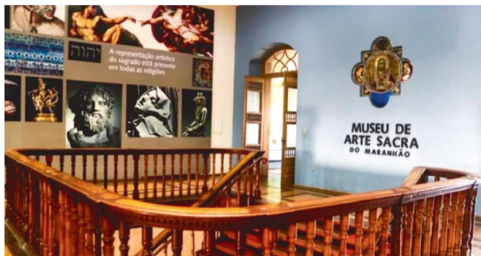
EQUIPAMENTO CULTURAL ESTÁ SEDIADO NO PALÁCIO ARQUIEPISCOPAL DE SÃO LUÍS

O acervo do Museu é composto por uma importante coleção com peças de imaginárias, ourivesaria e paramentos dos séculos XVII, XVIII e XIX