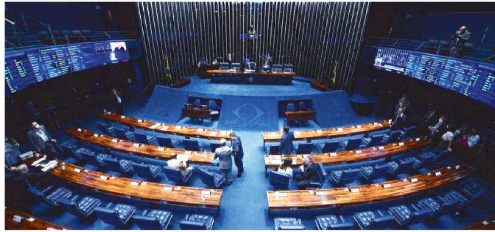
COM O ADIAMENTO DA VOTAÇÃO, AS CANDIDATURAS COLETIVAS VOLTARÃO A VALER

O presidente da Casa, Rodrigo Pacheco (PSD-MG), já havia sinalizado que a proposta andaria de forma mais cuidadosa no Senado. “Se for possível conciliar um trabalho bem feito com a