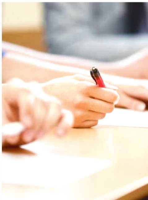
Para concorrer a uma das vagas é

Estrangeira (Inglês) (14); Professor de Língua Portuguesa (21); Professor de Matemática (16); Professor de Filosofia (8); Professor de Arte (8).