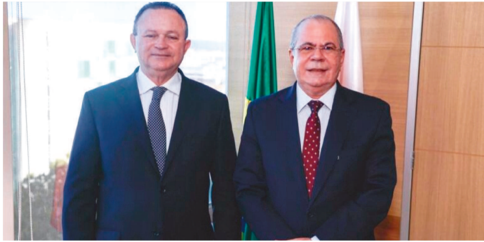
O GOVERNADOR AGRADECEU PELA RECENTE ENTREGA DE MORADIAS NO MARANHÃO

O governador agradeceu pela recente entrega de moradias do programa Minha Casa, Minha Vida no Maranhão e também reafirmou a parceria