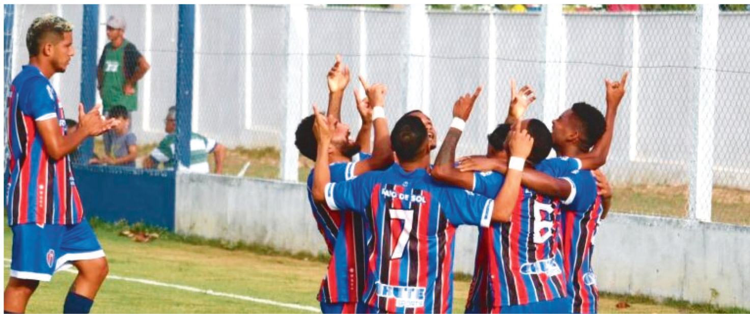
MAC ESTÁ COM 17 PONTOS GANHOS E TERÁ COMO PRÓXIMO ADVERSÁRIO O CORDINO. A PARTIDA SERÁ NO SÁBADO, EM SÃO LUÍS

Apesar de ter derrotado o Parnahyba por 3 a 0 no último domingo, aumentando sua chance de classificação para a próxima fase da Série D do Campeonato Brasileiro, o Maranhão Atlético Clube vai agora focar na briga para ficar com a segunda vaga – a primeira já é do Ferroviário – do Grupo 2. Para isso, terá de vencer os próximos jogos e torcer para que os demais concorrentes se afastem cada vez mais.