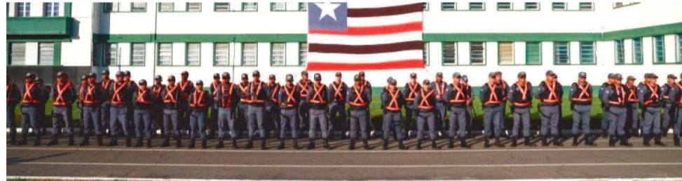
OPERAÇÃO SÃO JOÃO SEGURO ACONTECEU EM ARRAIAIS DOS MUNICÍPIOS DA ILHA