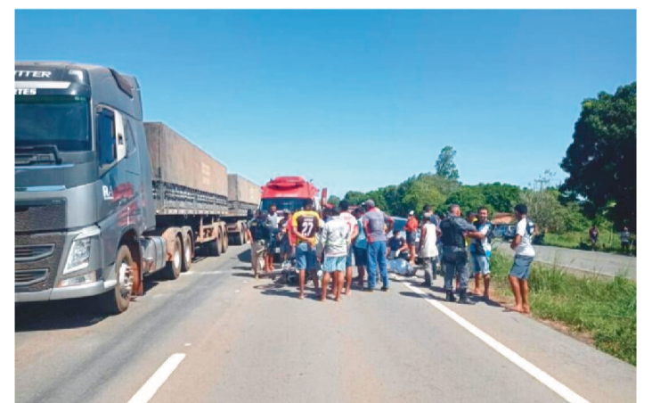
ACIDENTE FATAL ENVOLVEU DOIS VEÍCULOS

Um acidente grave foi registrado no fim da manhã desta quarta-feira (5), por volta das 11h30, e deixou uma pessoa morta. O caso ocorreu no km 78 da BR-135, próximo a Curva do Pepê, que fica localizada no município de Santa Rita.