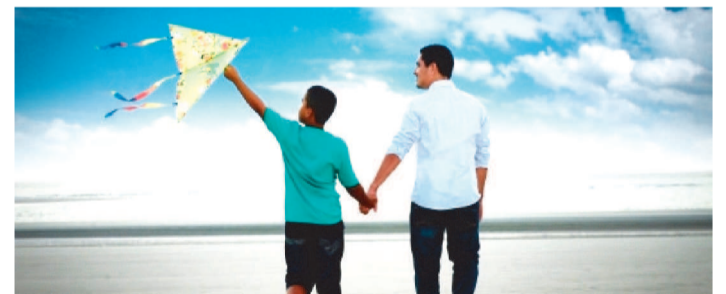
PROVIMENTO RESSALTA GRATUIDADE DO REGISTRO

A Corregedoria Geral da Justiça do Maranhão (CGJ-MA), alterou as regras dos atos de verificação de paternidade em Registro de Nascimento, com o objetivo de otimizar esses procedimentos nos cartórios de registro civil. O Provimento nº 23, de 5 de julho de 2023, altera os artigos 254; 307; 321 e 333 – todos do Código de Normas da Corregedoria, que define as regras relativas aos serviços judiciais e extrajudiciais da Justiça. O documento eletrônico oferece um fluxograma do procedimento de alegação de paternidade e um vídeo explicativo sobre o assunto, para facilitar a aplicação da norma, para oficiais de registro civil e servidores do Judiciário. De acordo com a nova redação, o exame dos atos notariais e registros será feito por meio de certidões de breve relato extraídas dos livros de notas e registro, para o exercício da advocacia, de modo adequado à Lei Geral de Proteção