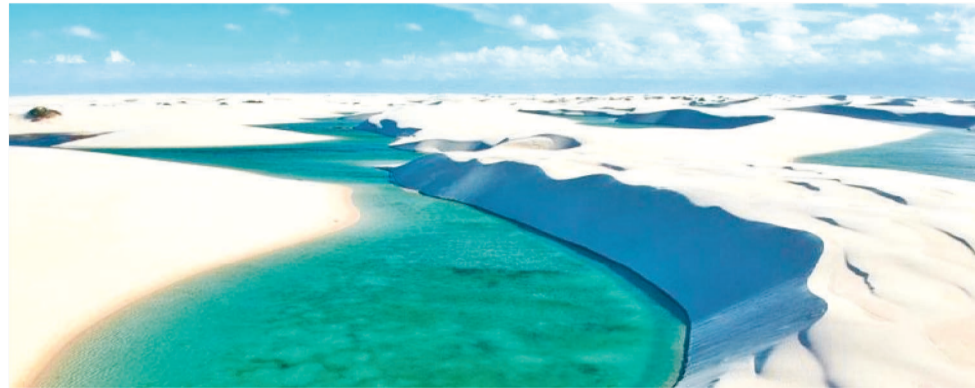
OPERAÇÃO OCORRERÁ NOS LENÇÓIS, DELTA DAS AMÉRICAS E CHAPADA DAS MESAS