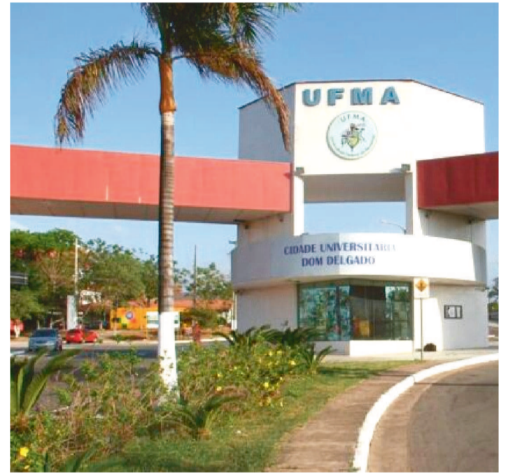
CONTRATADOS RECEBERÃO SALÁRIO NO VALOR DE R$ 3.412,63

A Universidade Federal do Maranhão abriu inscrições para um novo Processo Seletivo Simplificado de nível superior destinado à contratação de professores substitutos. As inscrições devem ser realizadas até 28 de julho. A inscrição é feita exclusivamente no Sistema Integrado de Gestão de Recursos Humanos (SIGRH) da UFMA.