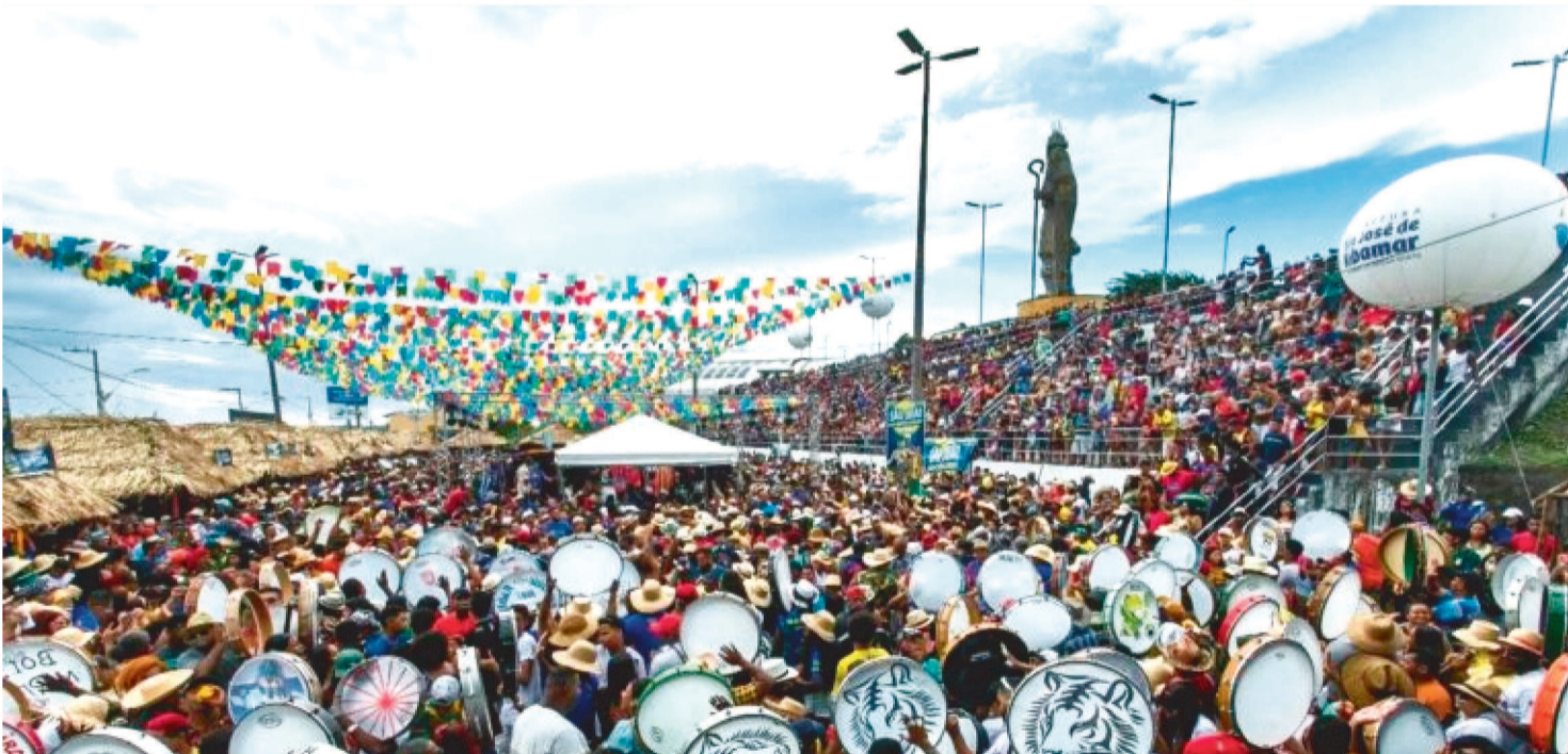
PRIMEIROS BATALHÕES QUE CHEGARAM À CIDADE FORAM OS DE BOIS DE ORQUESTRA COM O OBJETIVO DE PAGAR PROMESSAS

Uma das versões da origem do Lava-Bois, é de que a festa teve início nos anos 1950. O evento teria surgido de um ritual promovido por boieiros que foram até o município pagar uma promessa de São João. Os primeiros batalhões que chegaram à cidade foram os de orquestra, a convite de brincadeiras locais, mas também com o objetivo de pagar promessas.