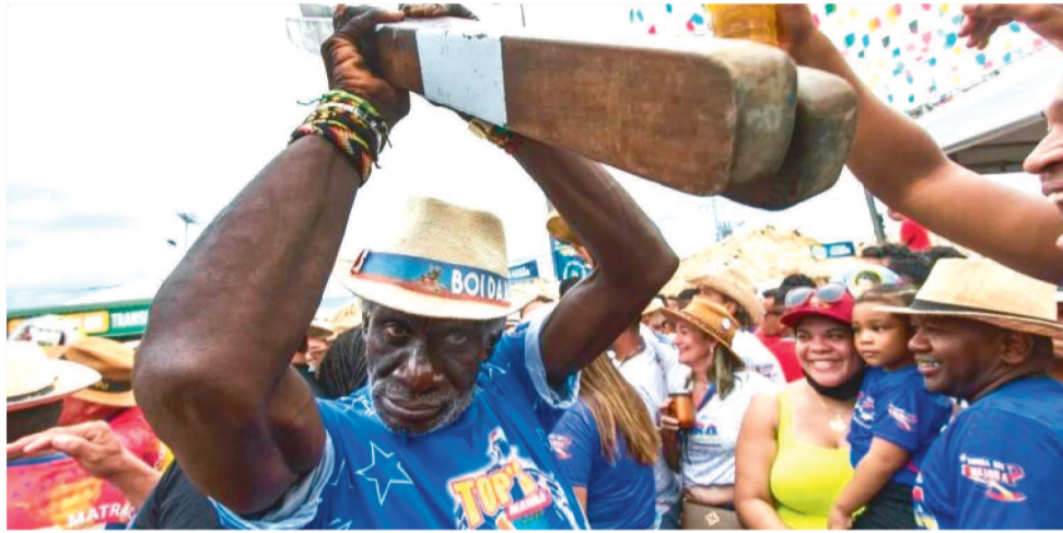
LAVA-BOIS 2023 ACONTECERÁ NO SÁBADO E DOMINGO COM DIVERSAS ATRAÇÕES

Domingo, dia 9, a programação começa às 8h, com os grupos de bois de matraca: Meu Boi Capricho, Bumba Meu Boi Brilho Tesouro da Ilha, Bumba Meu Boi do Sítio do Apicum, Bumba Meu Boi Disciplinador da Ilha, Bumba Meu Boi da Matinha, Bumba