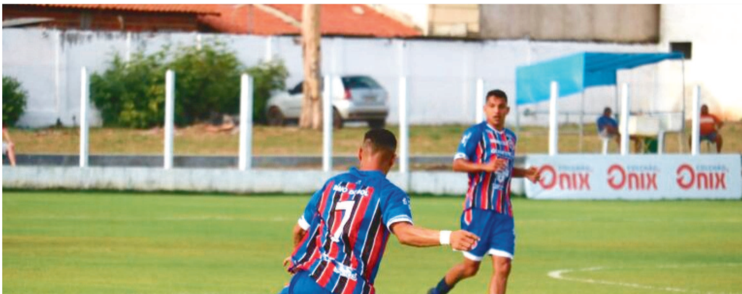
MAC PREPARA-SE PARA JOGO IMPORTANTE AMANHÃ EM SÃO LUÍS

Faltando apenas três rodadas para a conclusão da primeira fase desta Série D do Campeonato Brasileiro, todos os clubes disputantes ainda acreditam na possibilidade de ficar com pelo menos uma das quatro vagas que darão acesso à segunda fase. A briga maior, entretanto, está na disputa do segundo lugar, devido à vantagem de fazer o jogo decisivo do mata-mata em casa. O primeiro lugar já está definido em favor do Ferroviário, por antecipação, que também garantiu a decisão em Fortaleza, no Estádio Presidente Vargas.