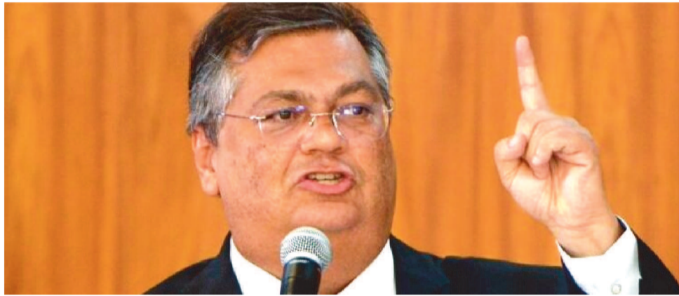
DE ACORDO COM DINO, EXISTE INDÍCIO DE DISCURSO DE ÓDIO E APOLOGIA À VIOLÊNCIA

Durante a manifestação, que se concentrou em frente ao Congresso Nacional, Eduardo afirmou que "professor doutrinador é pior do que traficante". Ele fez as declarações em cima de um trio elétrico.