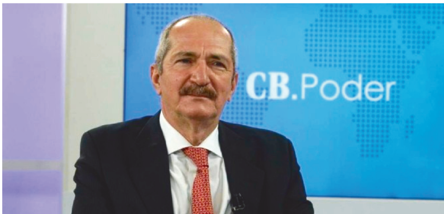
OITIVA ACONTECE DEVIDO AOS CARGOS JÁ OCUPADOS PELO CONVIDADO E DE SEU ENVOLVIMENTO COM PAUTAS DO MEIO AMBIENTE

A Comissão Parlamentar de Inquérito (CPI) que apura as ações das ONGs na Amazônia ouvirá, nesta terça-feira (11/7), o ex-deputado federal e ex-ministro Aldo Rebelo.