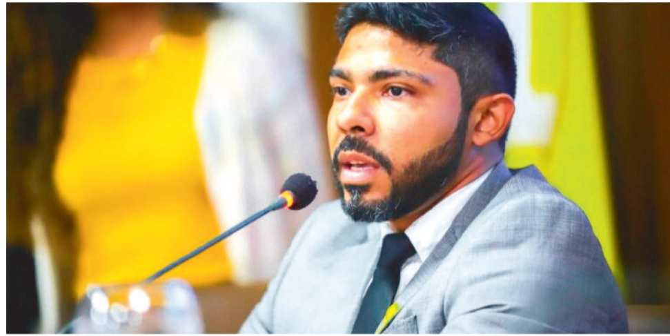
DIEGO RODRIGUES, TITULAR DA SECRETARIA MUNICIPAL DE TRÂNSITO E TRANSPORTES

“Primeiro temos uma denúncia com uma suspeita de que o secretário teria favorecido amigos promovendo a liberação de veículos, o que gera uma consequência, pois não é apenas uma situação isolada e, após isso, nós tivemos um caso triste e lamentável que foi um servidor público, um agente de trânsito que foi assassinado em serviço”, frisou.