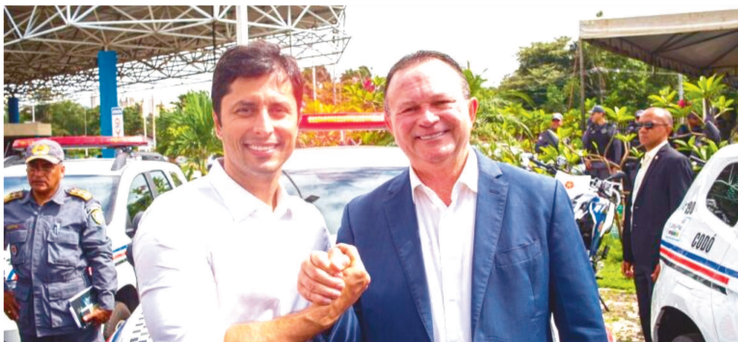
O DEPUTADO DUARTE JÚNIOR (PSB), MEMBRO DA COMISSÃO DE SEGURANÇA ACOMPANHOU A AGENDA COM CARLOS BRANDÃO (PSB)

Nesta segunda-feira, 10, foram entregues ao sistema de segurança pública do Maranhão, 61 veículos e 300 armas oriundas de recursos de emendas da bancada maranhense no Congresso Nacional. O deputado federal Duarte Júnior (PSB), membro da Comissão de Segurança da Casa, acompanhou a agenda ao lado do governador Carlos Brandão (PSB).