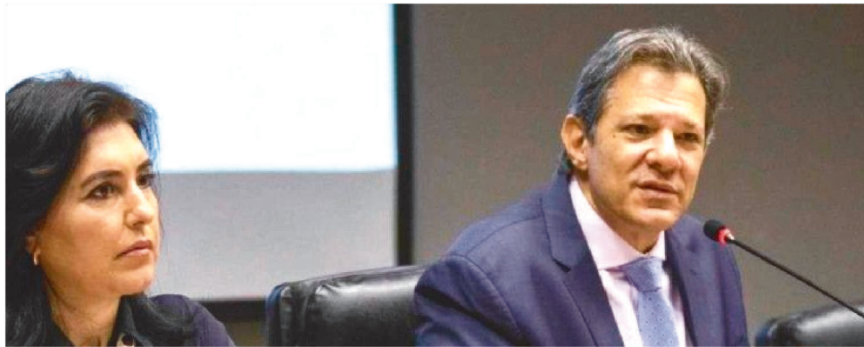
MINISTROS TAMBÉM DEVEM CONSIDERAR TODAS AS EXCEÇÕES PREVISTAS NO PROJETO

No requerimento, Marinho critica a reforma tributária e manteve o discurso da oposição de que a PEC au-