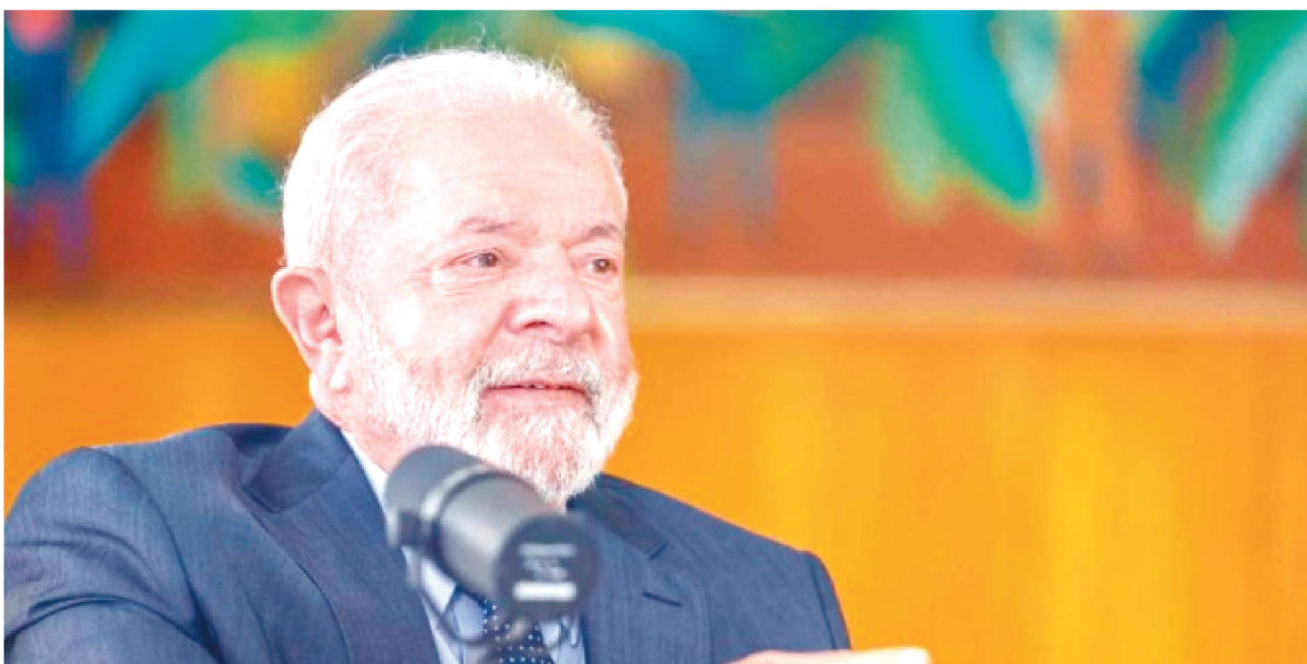
SEGUNDO O PRESIDENTE, “NÃO HÁ EXPLICAÇÃO” PARA A FILA DE ATENDIMENTOS PELO ÓRGÃO, QUE ULTRAPASSOU OS 1,7 MILHÃO

O presidente Luiz Inácio Lula da Silva (PT) anunciou nesta terça-feira (11/7) que o governo federal fará uma reunião nesta semana sobre a redução da fila do Instituto Nacional do Seguro Nacional (INSS). Segundo o presidente, “não há explicação” para a fila de atendimentos pelo órgão, que ultrapassou os 1,7 milhão de pedidos aguardando análise em junho.