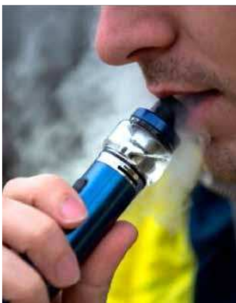
Em 1954, a marca Marlboro passou

“Vivi a infância e a adolescência aos 30 anos de idade. Faço essa relação. Eu deslumbrei, fiz um monte de bobagem”, confessa. Para o artista, muitas das decisões tomadas naquela época pela banda foram equivocadas. “Fomos gananciosos, preferimos o sucesso.”