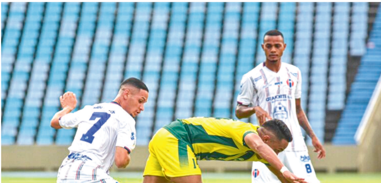
MARANHÃO PREPARA-SE PARA ENFRENTAR O TOCANTINS NO PRÓXIMO DOMINGO, NO CASTELÃO, PELA SÉRIE D DO BRASILEIRO

Anda vivendo momentos de expectativa para o jogo do próximo domingo, contra o Tocantinópolis, no Castelão, o Maranhão Atlético Clube segue catalogando nomes de alguns jogadores que poderão defender as cores atléticas na Série D do Campeonato Brasileiro, caso a equipe passe para a próxima fase. As chances de classificação dos atletas entre os quatro primeiros colocados são animadoras, pois no momento a equipe se encontra no terceiro lugar.