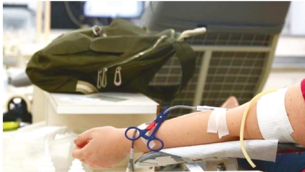
VALOR DESTINADO AO PROCEDIMENTO DE HEMODIÁLISE NO SUS AUMENTA 10,3%

Do investimento total, R$ 400 milhões serão destinados ao reajuste do valor do serviço na tabela SUS e R$ 200 milhões serão incentivo adicional para manutenção de equipamentos. O repasse acontecerá em duas etapas: 5% no mês de julho e mais 5,3% em setembro.