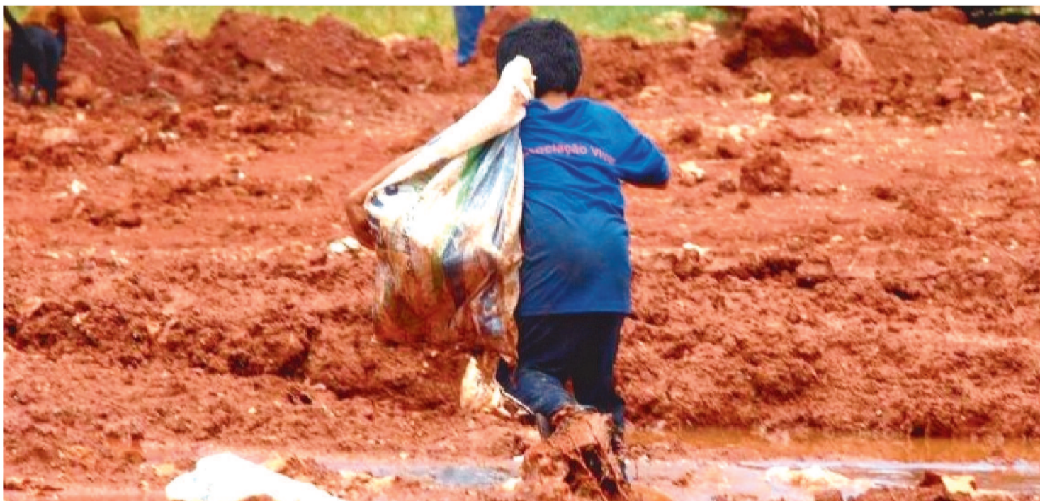
CASOS DE INSEGURANÇA ALIMENTAR GRAVE AUMENTARAM EM CINCO VEZES NOS ÚLTIMOS SETE ANOS, EM PORCENTAGEM

Segundo o relatório O Estado da Segurança Alimentar e Nutricional no Mundo 2023 (State of Food Security and Nutrition in the World (SOFI), divulgado nesta quarta-feira (12/7) pela Organização das Nações Unidas para Alimentação e Agricultura (FAO), 21,1 milhões de brasileiros se encontram em situação de insegurança alimentar grave no ano passado, o que representa quase 10% de toda a população brasileira.