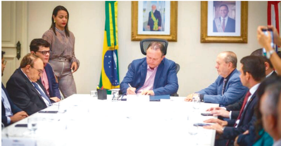
DECRETO DE CRIAÇÃO DO COMITÊ FOI ASSINADO NESTA QUARTA (12) PELO GOVERNADOR