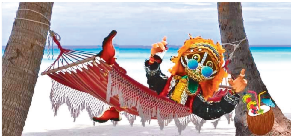
PERSONAGEM CAZUMBINHA, DO ARTISTA HUGO CAZUMBA, PARTICIPARÁ DA COLÔNIA

A Colônia começa nesta segunda-feira (17) com a oficina de cartonação e escrivinhagem, onde as crianças aprenderão a fazer os seus próprios diários para registrar suas impressões artísticas após cada oficina e termina na sexta-feira, dia 21, com uma oficina de construção de máscaras e uma