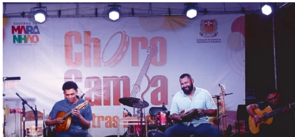
O ESPAÇO JÁ VAI RECEBER A SÉTIMA EDIÇÃO DO "CHORO, SAMBA E OUTRAS BOSSAS"