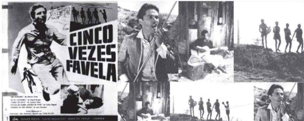
"CINCO VEZES FAVELA" É UM DOS FILMES BRASILEIROS QUE COMPÕE A MOSTRA

A convite do Instituto Cultural Vale, eu fui conhecer alguns projetos em São Paulo que são patrocinados pelo mesmo, dentre eles, o Projeto Viva Ci-