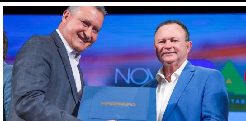
Ministro da Casa Civil, Rui Costa, e governador Carlos Brandão durante o lançamento do Novo PAC no Maranhão

Mais infraestrutura, moradia, saneamento básico, escolas, unidades de saúde entre outros investimentos para melhorar a qualidade de vida da população maranhense e garantir mais desenvolvimento econômico, social e geração de emprego e renda no estado. Isto é o que vai representar os investimentos de R$ 94 bilhões do Novo Programa de Aceleração do Crescimento (PAC) no Maranhão. O lançamento oficial do programa aconteceu nesta segunda-feira (6), em São Luís, com a participação do governador Carlos Brandão e do ministro-chefe da Casa Civil, Rui Costa, coordenador nacional do programa.