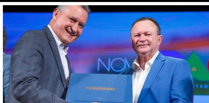
Ministro da Casa Civil, Rui Costa, e governador Carlos Brandão durante o lançamento do Novo PAC no Maranhão

Mais infraestrutura, moradia, saneamento básico, escolas, unidades de saúde entre outros investimentos para melhorar a qualidade de vida da população maranhense e garantir mais desenvolvimento econômico, social e geração de emprego e renda no estado. Isto é o que vai representar os investimentos de R$ 94 bilhões do Novo Programa de Aceleração do Crescimento (PAC) no Maranhão. O lançamento oficial do programa aconteceu nesta segunda-feira (6), em São Luís, com a participação do governador Carlos Brandão e do ministro-chefe da Casa Civil, Rui Costa, coordenador nacional do programa.