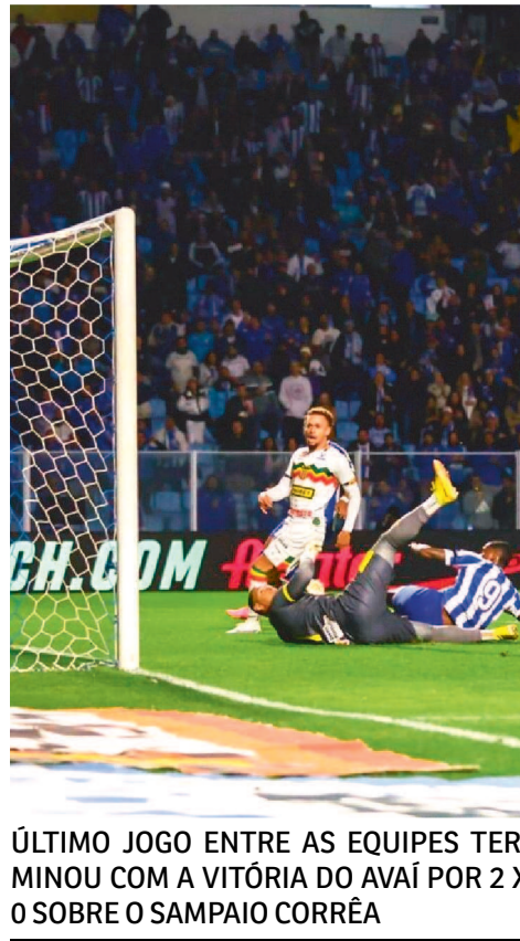
ÚLTIMO JOGO ENTRE AS EQUIPES TERMINOU COM A VITÓRIA DO AVAÍ POR 2 X 0 SOBRE O SAMPAIO CORRÊA

zerra Lopes Caetano (RO). Quarto árbitro: Wallas Martins (MA); Árbitro de Vídeo: Gilberto Rodrigues Castro Júnior (PE).