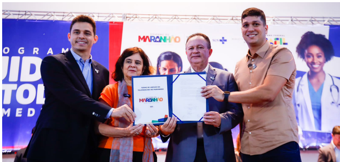
EVENTO FOI MARCADO PELA PRESENÇA MINISTRA DA SAÚDE NÍSIA TRINDADE