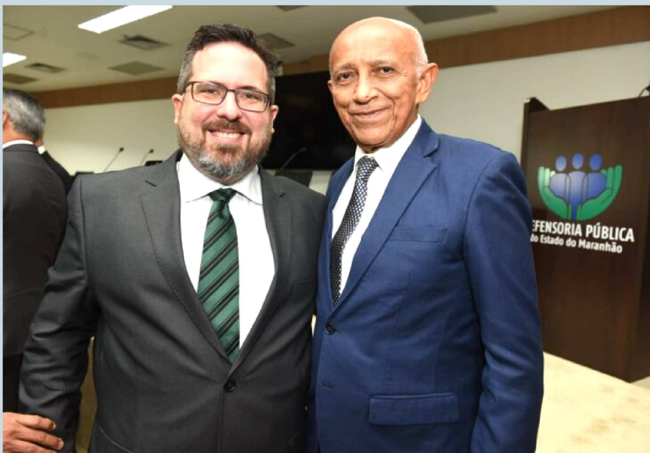
Na foto com o presidente da FIEMA, Edilson Baldez, o defensor público-geral do Estado, pernambucano Gabriel Furtado