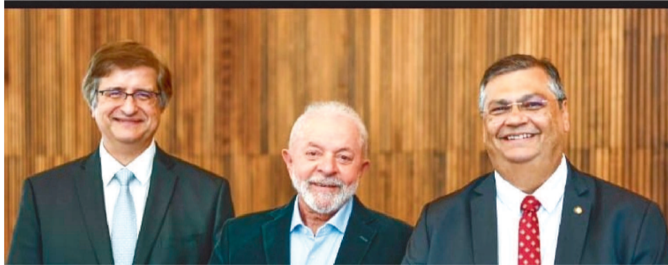
FLÁVIO DINO E PAULO GONET DEVEM, AGORA, SER AVALIADOS PELO SENADO FEDERAL

O anúncio foi feito após uma manhã de reuniões no Palácio da Alvorada.