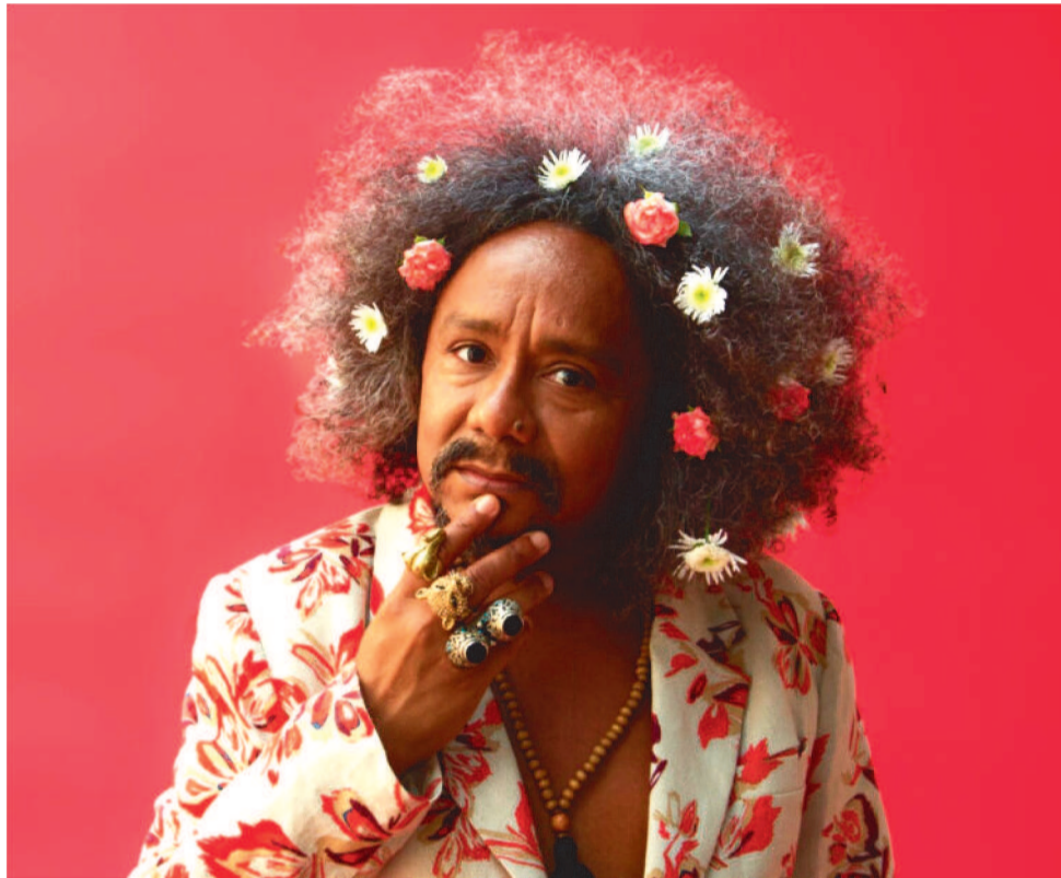
O CANTOR SE APRESENTA NA PRÓXIMA QUINTA, 7, NA CONCHA ACÚSTICA DA LAGOA

A Feira tem como objetivo promover o fortalecimento da agricultura familiar por meio da divulgação das inovações tecnológicas de iniciativas do produtor rural, da exibição das riquezas e potencialidade dos territórios que incentivem a melhoria socioeconômica dos agricultores familiares e a sustentabilidade da produção.