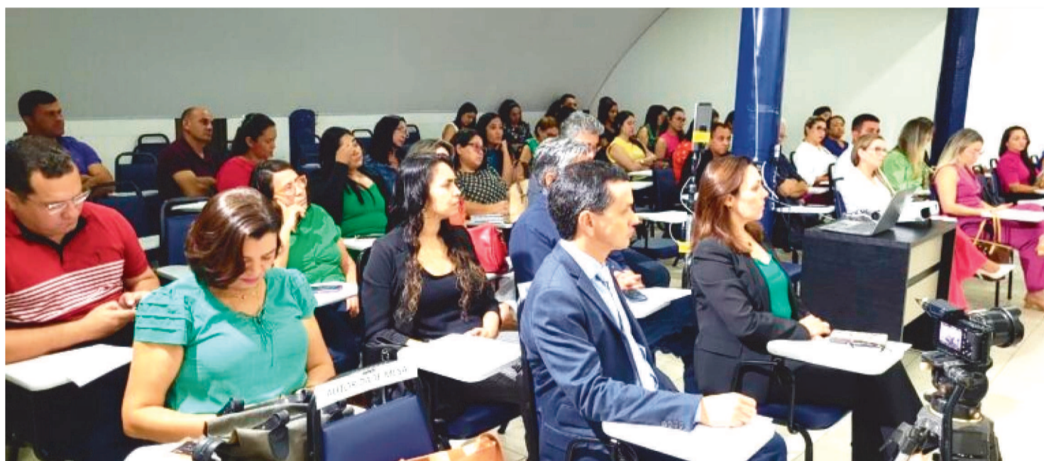
EVENTO FOI DIRECIONADO A PROFESSORES, GESTORES DA REDE PÚBLICA DE ENSINO E PROFISSIONAIS DA ÁREA DE SAÚDE

Nesta terça-feira (28), o auditório da Federação dos Municípios do Estado do Maranhão – Famem foi palco de uma capacitação voltada para a notificação compulsória de lesões autoprovocadas.