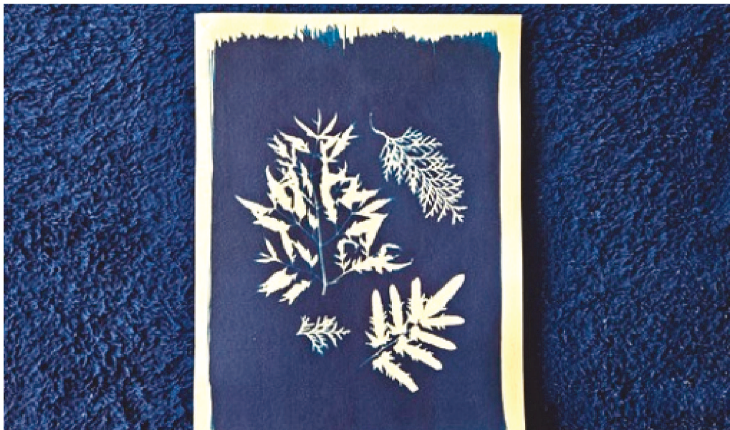
COM TÉCNICAS DE CIANOTIPIA, AS AULAS PROMOVEM UMA CONSCIENTIZAÇÃO ACERCA DA PRESERVAÇÃO DOS ECOSISTEMAS LOCAIS

Destinada a alunos de escola pública, a oficina Impressões Amazônicas, aprovada no edital "Ocupa CCVM Amazônia em Foco", explorará o conhecimento de botânica amazônica, por meio de experimentações de processos fotográficos alternativos. A oficina será realizada de 29 novembro a 02 dezembro no Centro Cultural Vale Maranhão (CCVM).