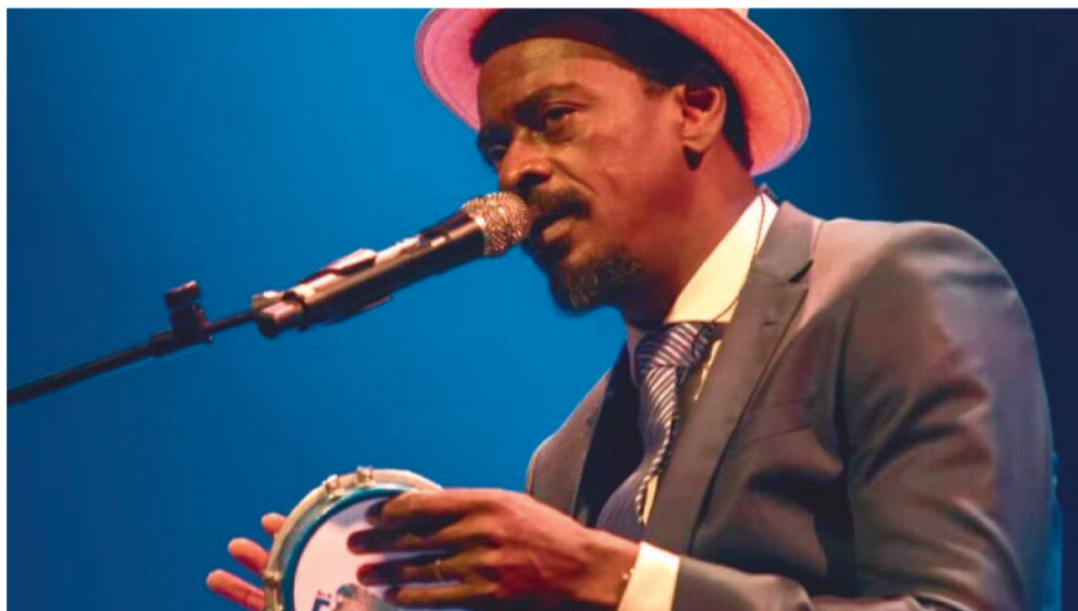
SEU JORGE SERÁ UMA DAS ATRAÇÕES PRINCIPAIS DO FESTIVAL, ELE SE APRESENTA DIA 15

No sábado, 16 de dezembro, quem abre os trabalhos é a Orquestra Big Band, da Escola de Música do Mara-