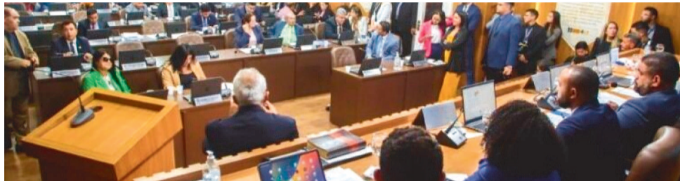
21 VEREADORES DA CÂMARA MUNICIPAL DE SÃO LUÍS ASSINARAM O REQUERIMENTO