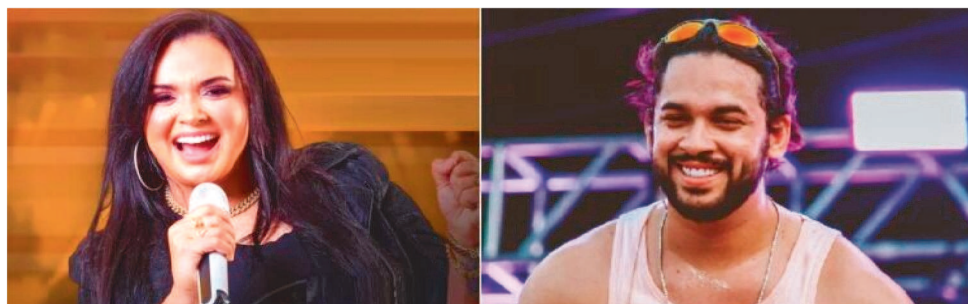
SEIS SUPER ATRAÇÕES COMANDARÃO A FESTA CELEBRANDO A CHEGADA DE 2024