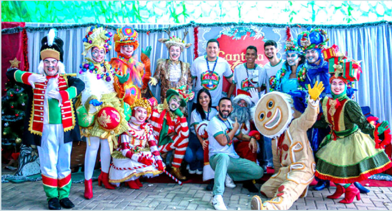
O time da CDL São Luís com o Papai Noel e sua trupe