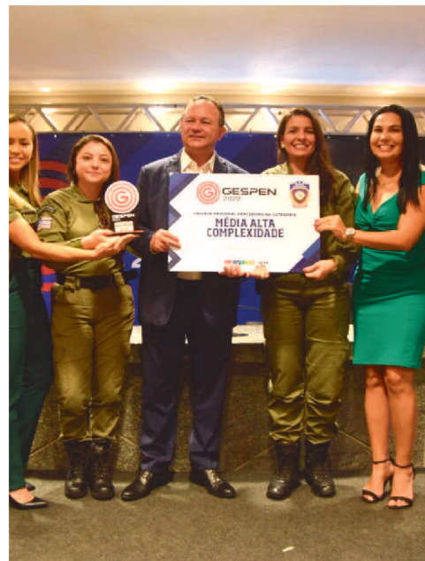
Modernização e segurança Os avanços na modernização e se-

Unificadas da Unidade Prisional de Ressocialização de Balsas e da Penitenciária Regional de São Luís (PRSLZ) e Unidade Prisional de Segurança Máxima (UPMAX), bem como a construção da Associação dos Associados de Proteção e Assistência aos Condenados – APAC de Timon.