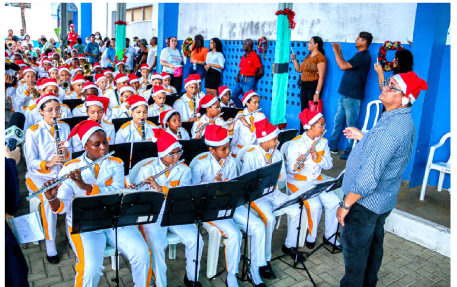
A banda do Bom Menino deu um show, usando a música como instrumento de união e amor.