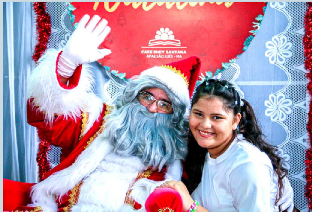
A emoção de estar bem pertinho do Papai Noel ficou estampada na face da aluna da APAE de São Luís