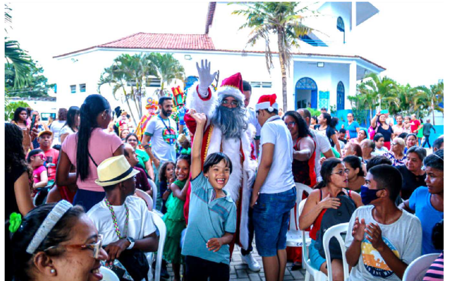
O Papai Noel foi recebido com entusiasmo pelos participantes da Cantata Natalina da APAE de São Luís