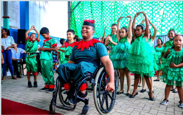
Alunos do CAEE Eney Santana que usaram a arte para expressar os melhores sentimentos natalinos