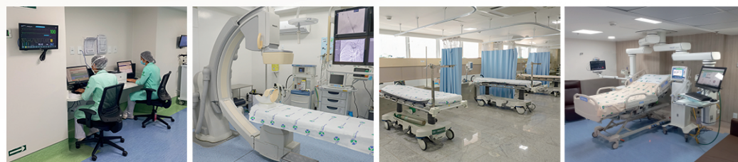
CENTRO DE CARDIOLOGIA