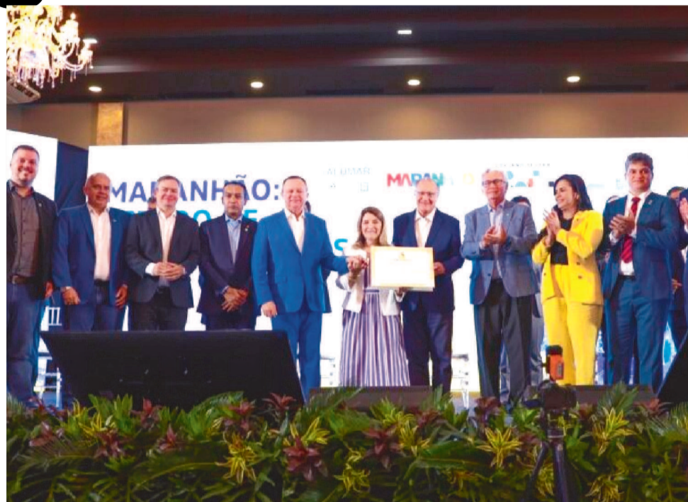
GERAÇÃO DE EMPREGOS FOI UMA DAS METAS DO GOVERNO DO MARANHÃO EM 2023

No final do mês de outubro, dados do Novo Cadastro Geral de Empregados e Desempregados (Novo Caged), divulgados pelo Ministério do Trabalho e Emprego, confirmaram um cenário positivo na relação demitidos e admitidos no Maranhão, com um total de 603,42 mil postos de emprego formal, representando acréscimo de 24,57 mil empregos com carteira assinada, na comparação com o ano passado. “Os ótimos resultados que o Estado apresentou durante o ano são consequência das decisões do governo Carlos Brandão de investir na construção de equipamentos públicos, na valorização da cultura, do turismo e em parcerias com o setor privado”, afirmou o secretário de Estado do Trabalho e Economia Solidária (Se-