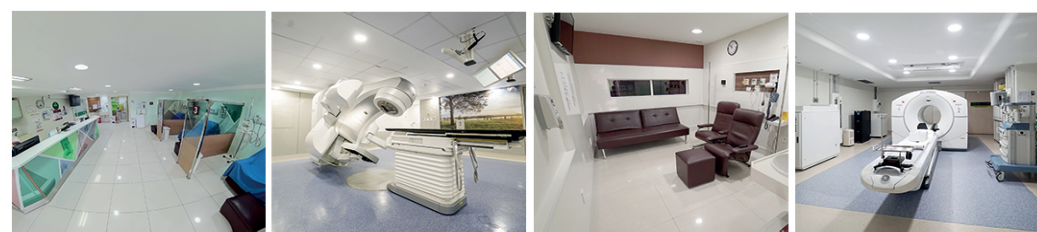
CENTRO DE ONCOLOGIA