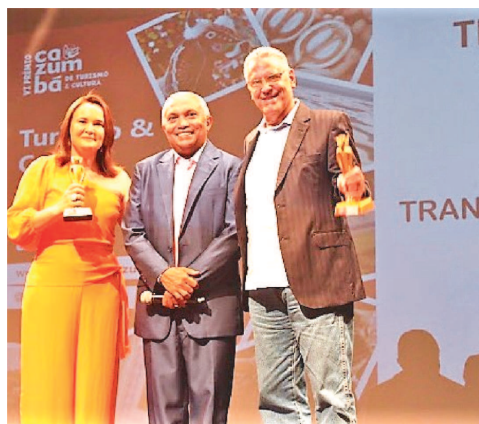
MARENCANTO TRANSPORTES E TURISMO RECEBEU 02 ESTATUETAS PELO SEU TRABALHO DIFERENCIADO