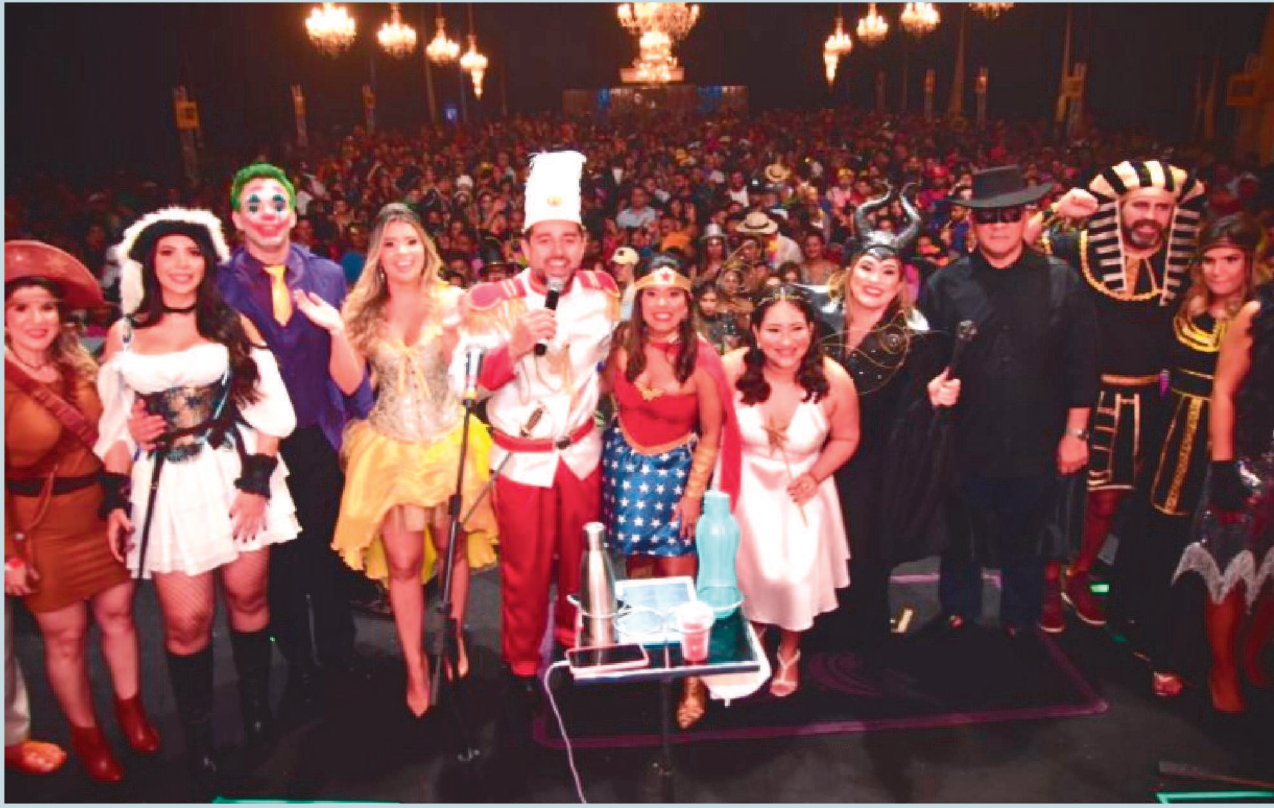
Uma festa bonita que reuniu mais de 3.500 pessoas. Na foto, momento que a diretoria da OAB/MA agradece ao público