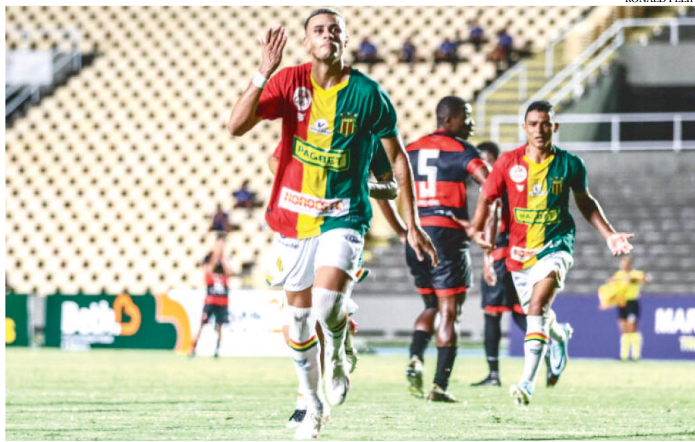
SAMPAIO VENCEU O MOTO POR 2 X 0 E ELIMINOU O PAPÃO DA DECISÃO DO 1º TURNO

Neste segundo turno, o Sampaio jogou duas vezes, conquistou duas vitórias, nenhum empate, zero derrota, marcou 9 gols e sofreu 1, tem saldo positivo de 8 gols. O aproveitamento técnico é de 100%. Na sua última