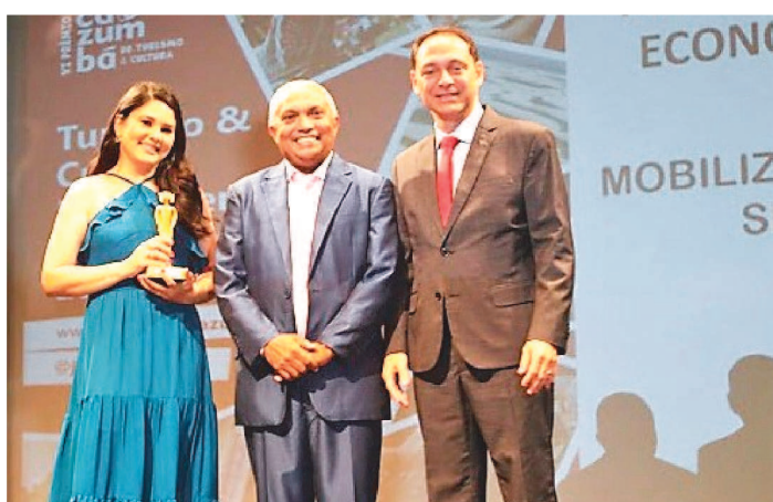
O SEBRAE-MA RECEBEU O TROFÉU CAZUMBÁ, NA CATEGORIA, TURISMO, INOVAÇÃO E ECONOMIA CRIATIVA.