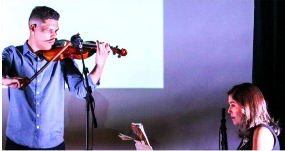
O ESPETÁCULO ABRANGE APRESENTAÇÕES TEATRAIS, MUSICAIS E DE DANÇA

com aulas particulares de música, o Olímpia Centro de Arte expandiu sua oferta para incluir cursos de dança e Yoga após o período de pandemia.