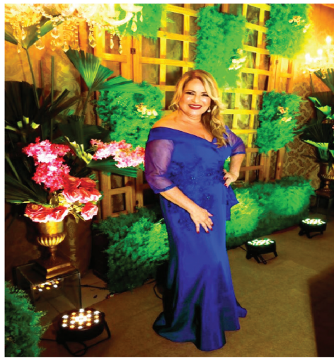
UM MIX DE LUXO, ELEGÂNCIA E SUCESSO

O Programa Nobre é assistido por mais de 8 milhões de telespectadores, através da REDETV São Luís, TV Difusora de Santa Inês e em rede nacional e mais de 80 países, pela Amazon Sat.