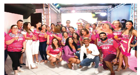
FOFA COM UM ANIMADO GRUPO DE AMIGOS