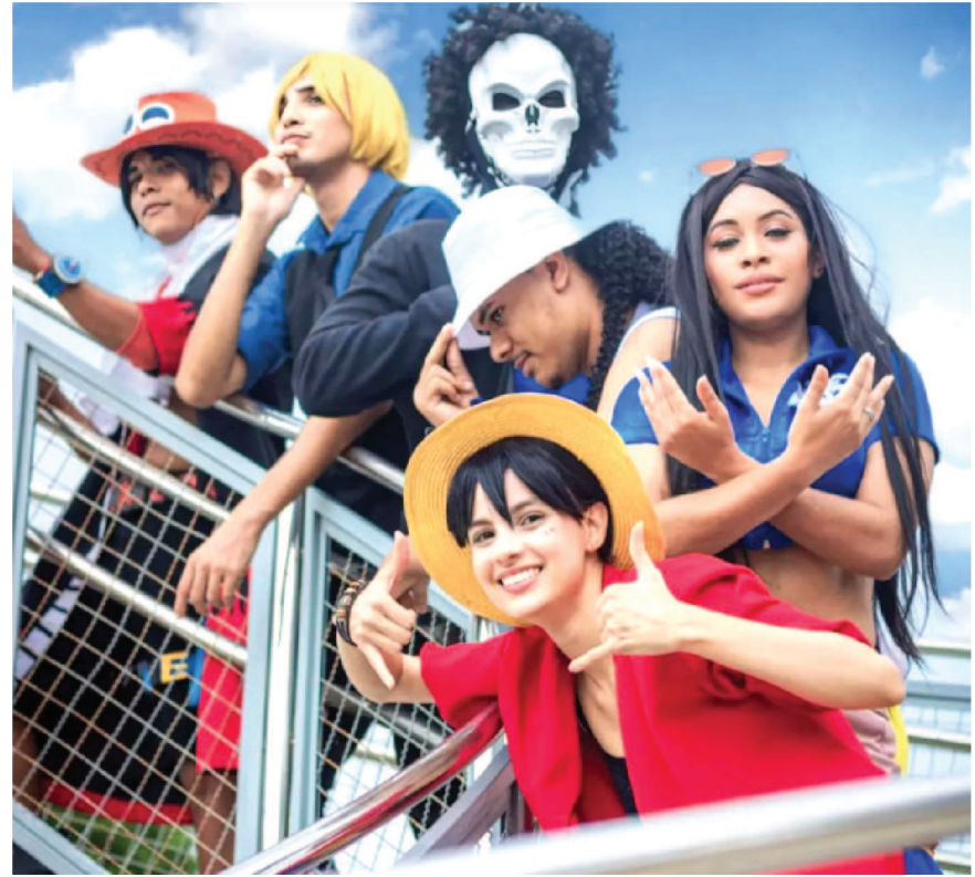
A Sala Temática One Piece vai acontecer na Área de Vivência do Sesc Deodoro