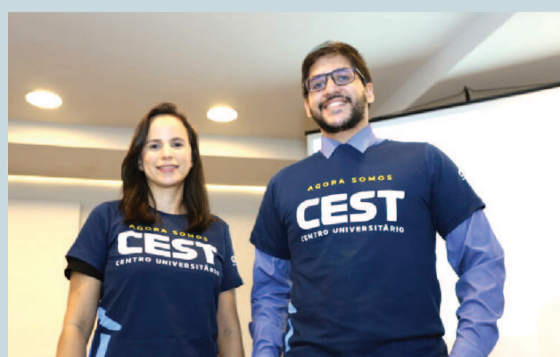
Carol Castro e Marco Aurélio Diniz