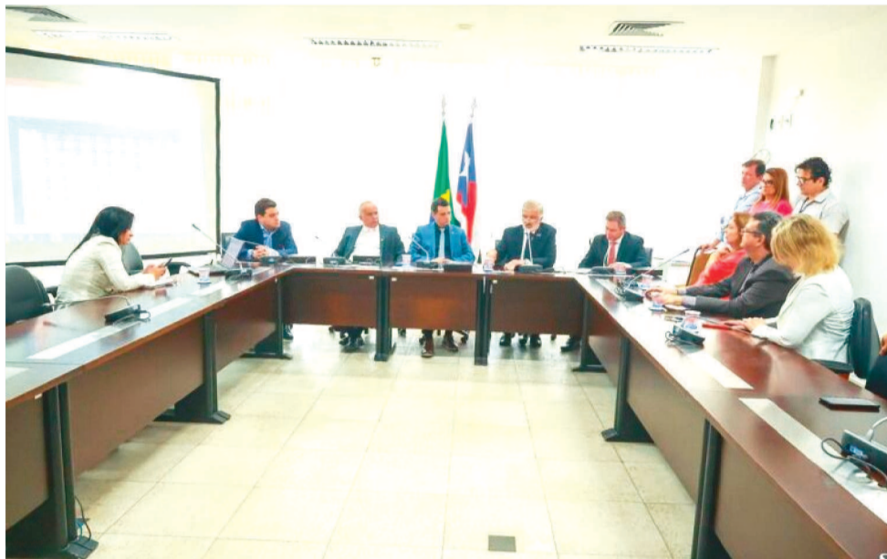
DEPUTADOS DE UMA COMISSÃO EM REUNIÃO NA SALA DE COMISSÕES

A partir da formação destes blocos, os líderes indicam os nomes que vão compor as comissões permanentes. Segundo apurou O Imparcial, estas