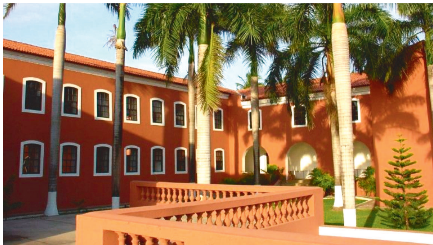
A MOSTRA DE ARTES VISUAIS DE TEMÁTICA LIVRE, CONCEDE PREMIAÇÃO PARA ARTISTAS DO MARANHÃO, PROPOSTA PELA FMRB

Foram prorrogadas, até o dia 11 de março, as inscrições para a exposição "30 cores em Maio – Salão de Arte", no Convento das Mercês.