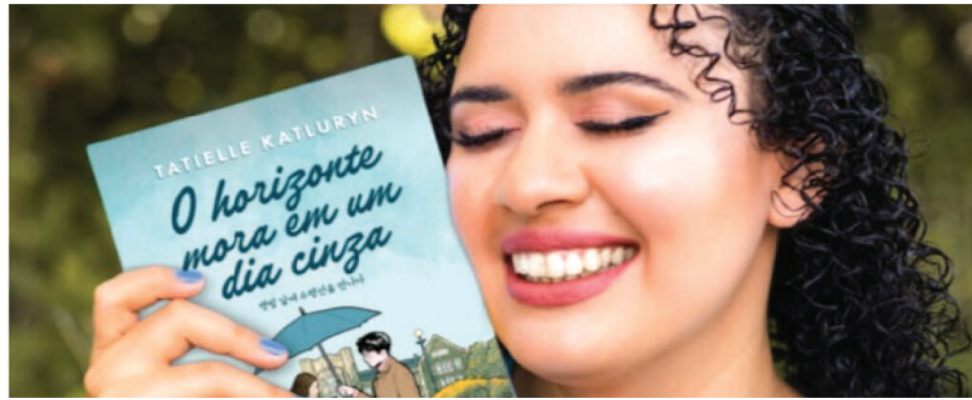
LIVRO FOI LANÇADO PELA MUNDO CRISTÃO, UMA DAS PRINCIPAIS EDITORAS DO BRASIL

O evento de lançamento está marcado para o dia 27 de abril, às 15h00, no shopping São Luís, na livraria Leitura. Para tornar o momento ainda