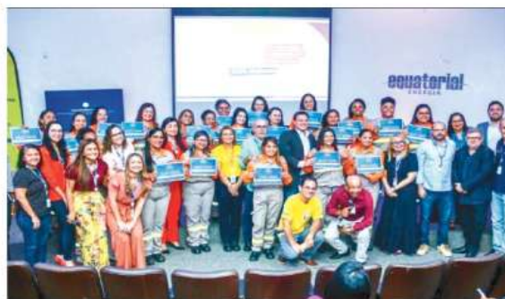
Certificação Escola de Eletricistas - Turma 100% mulheres