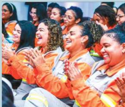
Mulheres no mercado de trabalho - Equatorial forma 21 novas eletricistas

A turma exclusiva de mulheres formou 21 alunas capacitadas para ingressar no mercado de trabalho do ramo da eletricidade, ocupação que antes era vista como uma profissão mais direcionada ao público masculino. Ao todo, a Escola de Eletricistas já formou gratuitamente mais de 80 profissionais desde o começo do ano no Maranhão.