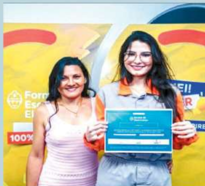
21 mulheres foram certificadas pela Escola de Eletricistas