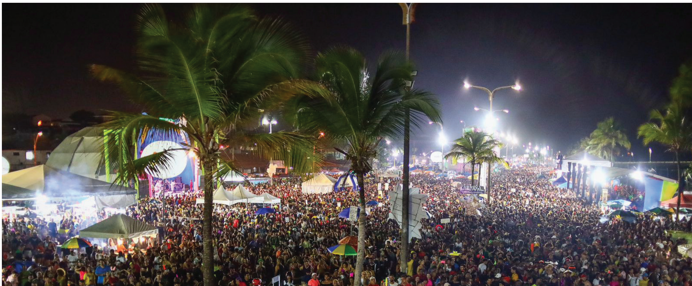
GOVERNO DO ESTADO MARCA POSIÇÃO E REINSTALA ORNAMENTAÇÃO DO CIRCUITO BEIRA-MAR, QUE JÁ É MARCADA GESTÃO

Carnaval de São Luís em 2024 está no epicentro de um campo de batalha político entre a prefeitura e o governo do Estado. O foco desse embate é o tradicional Circuito Beira Mar, que tornou-se o pivô de uma disputa pelo espaço da folia de Momo, requerido tanto pelo prefeito Eduardo Braide (PSD) quanto pelo governador Carlos Brandão (PSB), colocando assim, uma “pá de cal” na possível parceria institucional entre os dois gestores públicos.