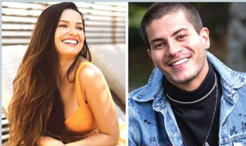
Arthur Aguiar, que ganhou R$1,5 milhão na edição 2022, valeria R$1.448.071,05. Já o segundo menor prêmio em valor real é de Juliette, vencedora de 2021.