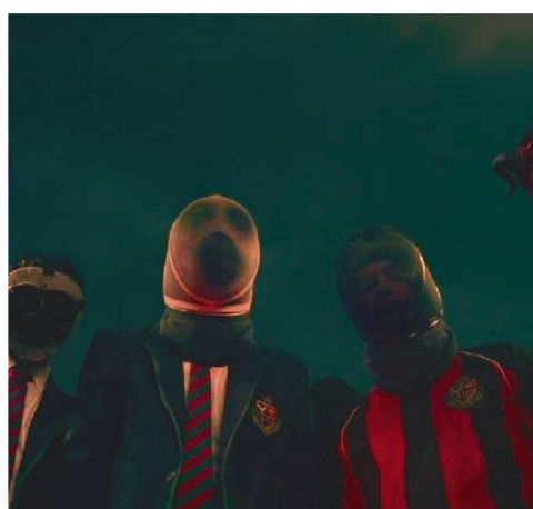
A série tem roteiro assinado por Danny Brocklehurst

Os jogos da discórdia não irão retornar em 2024. No lugar dele haverá o "Sincerão", um quadro que ainda não foi explicado pela direção do programa.