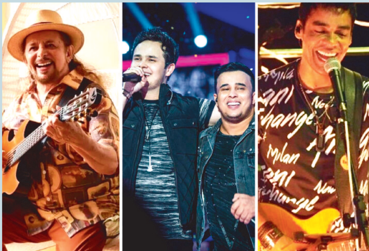
A diversidade de estilos e ritmos vai ficar por conta do cantor pernambucano Geraldo Azevedo, da dupla sertaneja Matheus e Kauan e da banda baiana, Chiclete com Banana

Além de Geraldo Azevedo, também já foram confirmadas as apresentações da dupla sertaneja Matheus e Kauan e a banda baiana, Chiclete com Banana. A programação vai contar, mais uma vez, com os Circuitos Beira-Mar e Litorânea como pontos de encontros entre os foliões que estiverem presentes na capital maranhense.