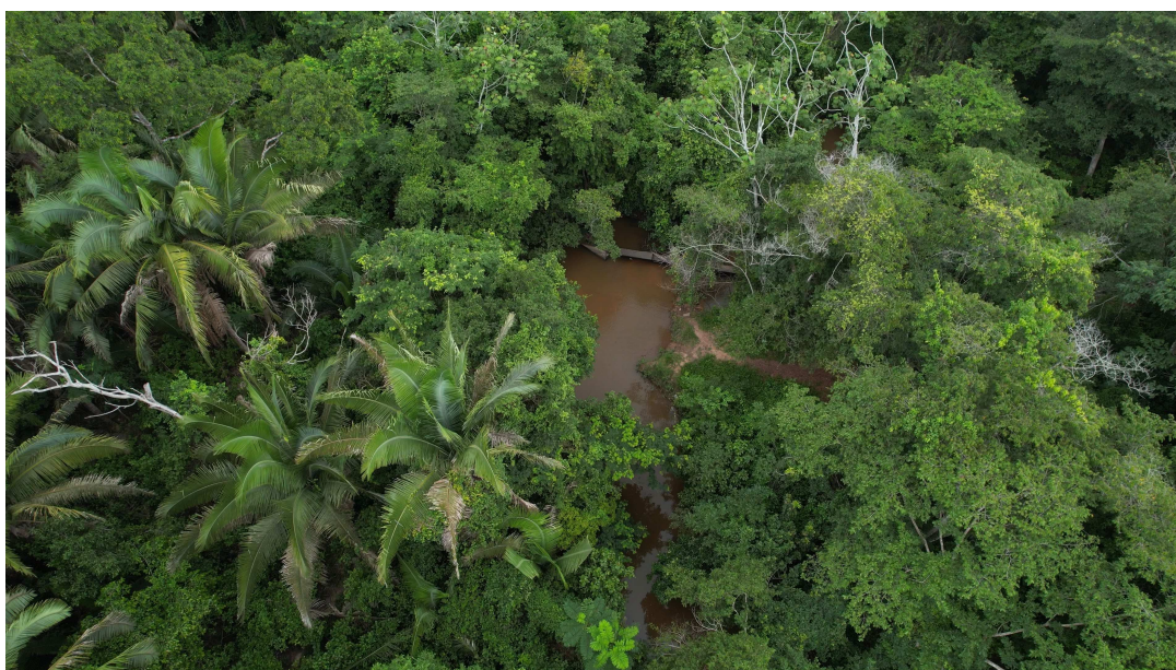
Em Timon, foram investidos R$ 37 milhões somente no ano de 2021, com a construção de uma Estação de Tratamento de Esgoto e 30 mil metros de tubulação

Nos últimos cinco anos, a média anual de investimento no setor de saneamento básico foi de R$ 20 bilhões. Em 2021, por exemplo, que é o dado mais atualizado disponível, o Brasil investiu R$ 17,3 bilhões no setor. Para conseguir universalizar água e esgoto para todos os brasileiros, esse valor precisaria ser de R$ 44,8 bilhões por ano.