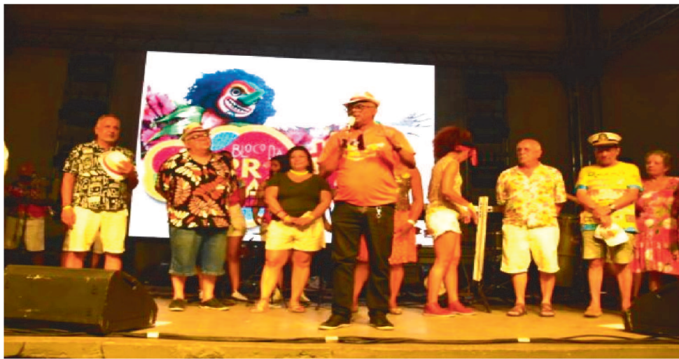
PROFISSIONAIS DA IMPRENSA FORAM HOMENAGEADOS NO PALCO DO CEPARAMA