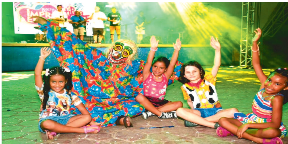
UM ESPAÇO PARA TODOS OS FOLIÕES