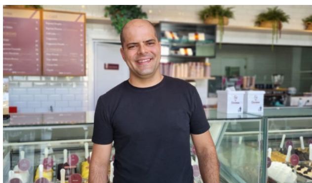
Para o proprietário da Ramos Agropecuária, de Barreirinhas, as consultorias do Sebraetec o ajudaram a enxergar novas oportunidades