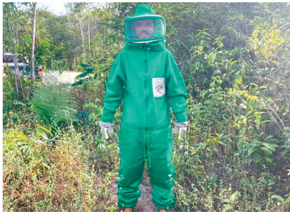
RAMOS AGROPECUÁRIA, DE BARREIRINHAS, UTILIZOU AS CONSULTORIAS DO SEBRAETEC

Em 2023, o Sebrae Maranhão injetou R$ 8.582.474 nos mais de 600 empreendimentos maranhenses beneficiados pelo programa no período. “Desde o início de suas operações, o Sebraetec tem desempenhado um papel crucial no impulsionamento das micro e pequenas empresas maranhenses, proporcionando-lhes acesso a serviços especializados e tecnológicos. Ao longo dos anos, testemunhamos um aumento significativo na demanda pelos serviços oferecidos pelo Sebraetec, indicando a crescente conscientização das empresas locais sobre a importância da inovação e