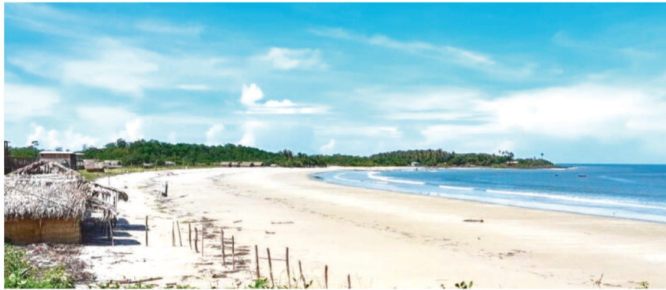
BATIZADA DE CAMINHO DOS POETAS, PRAIA SERÁ NOVO DESTINO TURÍSTICO DO ESTADO

Com investimento de mais de R$16 milhões, a nova via tem 6 metros de largura, acostamentos em ambos os lados, sinalização eficiente e sistema de drenagem para prevenir problemas como alagamentos e erosões.