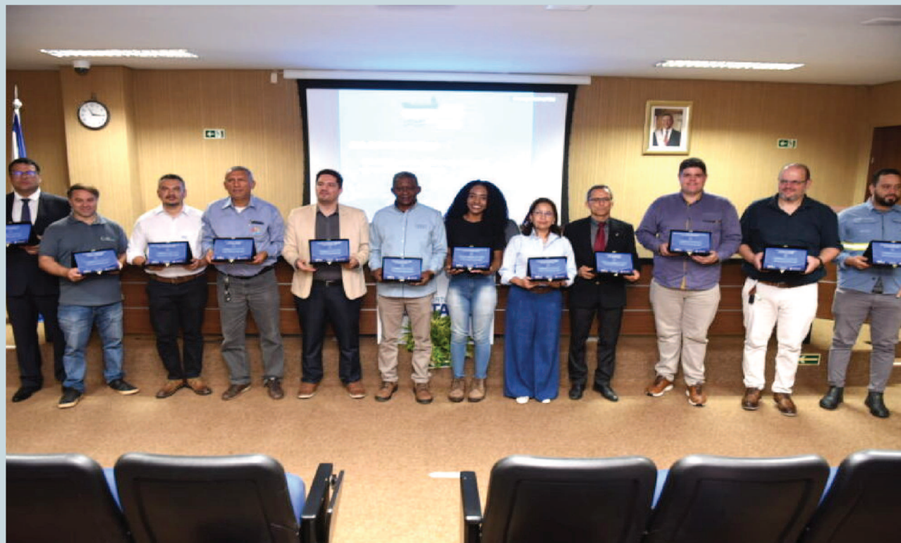
Representantes dos órgãos e de empresas homenageados pelo Dia do Portuário