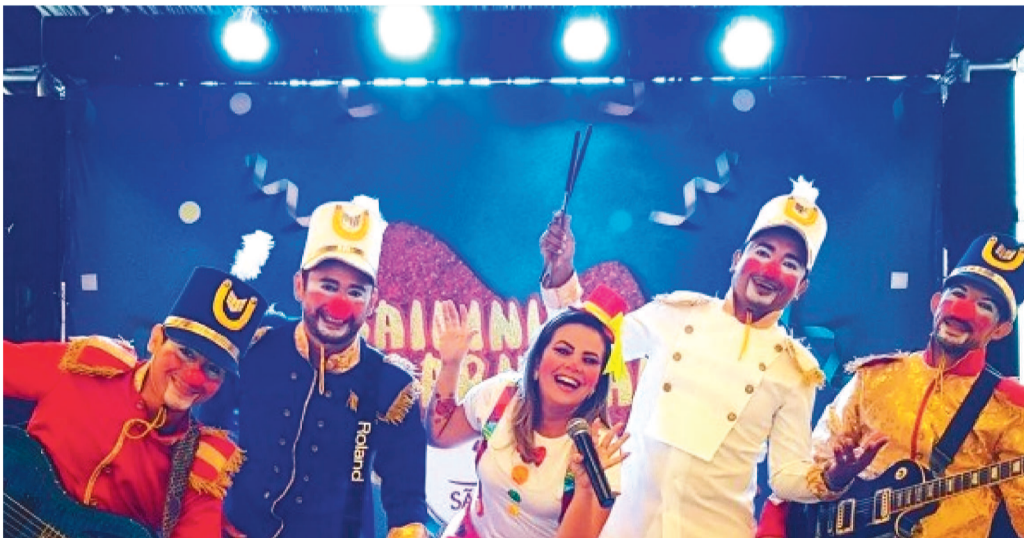
A PROGRAMAÇÃO TERÁ A BANDA CURUMIM PERALTA, RECREAÇÃO, SHOW DA PATRULHA CANINA E A BANDA UNIDUNITÊ

Um baile para a criançada se divertir neste Pré-Carnaval é a grande novidade deste final de semana na programação realizada pelo Governo do Estado. O Baile Infantil será no sábado (3), a partir das 17h, na Beira-Mar.