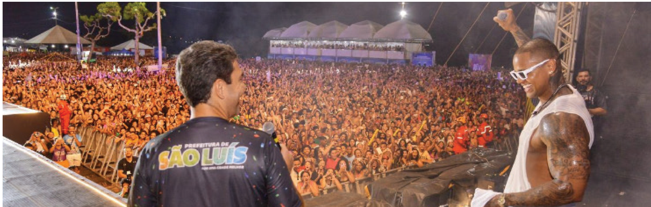
Shows de Léo Santana no Pré-Carnaval da Prefeitura de São Luís levou mais de 200 mil pessoas ao 'Centro Histórico'. No Carnaval é esperado publico semelhante ou superior no show do DJ Alok. Mas, greve ameaça folia na "Cidade do Carnaval"