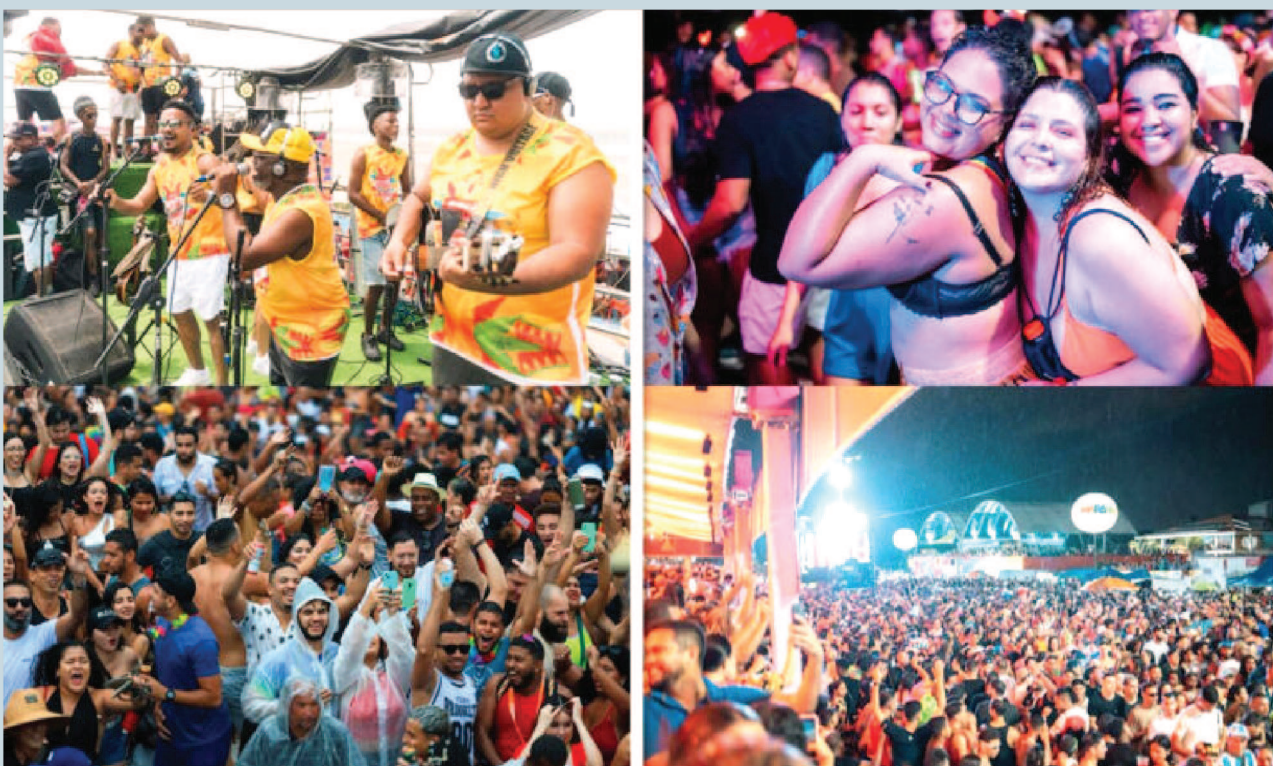
O evento reuniu centenas de milhares de pessoas, entre turistas e maranhenses, em todos os dias de folia

O Governo do Maranhão promoveu o maior Carnaval da história do estado, com um público estimado em mais de três milhões de pessoas nos circuitos oficiais em São Luís. Atrações como Claudia Leitte, Gustavo Lima, Geraldo Azevedo, Belo, Jonas Esticado, É o Tchan e Chiclete com Banana, entre outros nacionais e locais, garantiram muita folia, segurança e geração de renda. “Um mar de felicidade! Assim foi o nosso circuito Litorânea, com atrações nacionais e locais e a energia contagiante do começo ao fim. A multidão se fez presente e cantou durante todo o percurso da folia”, postou o governador Carlos Brandão, que já está convidando para a edição 2025: “A festa desse ano foi inesquecível e já entrou pra história. Deixo meu convite para todo mundo. Em 2025, vem passar Carnaval no Maranhão”. Quesito muito elogiado também foi a segurança de todo o evento. Por meio de uma abordagem integrada, o Sistema de Segurança Pública garantiu a diversão de todos os foliões que optaram por São Luís para desfrutar do período