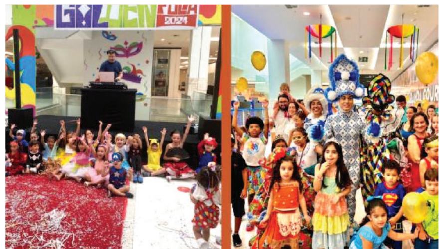
A folia ainda não encerrou no Golden Shopping Calhau. Neste fim de semana, o agito continua para a garotada no sábado (17) com o “Lavapratinhos”, a partir das 16h, evento ideal para quem não pôde curtir o Carnaval ou para quem deseja repetir a dose da grande folia que teve no empreendimento nos últimos dias. A animação ficará por conta de um pocket show com os Bolofofos.