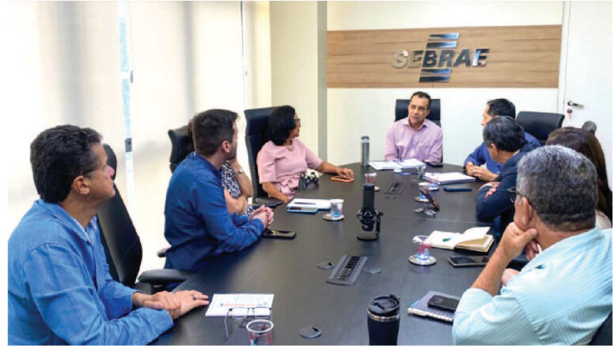
Presidente do Conselho Deliberativo do Sebrae Maranhão recebeu secretária de Estado do Turismo na sede da instituição, na capital São Luís