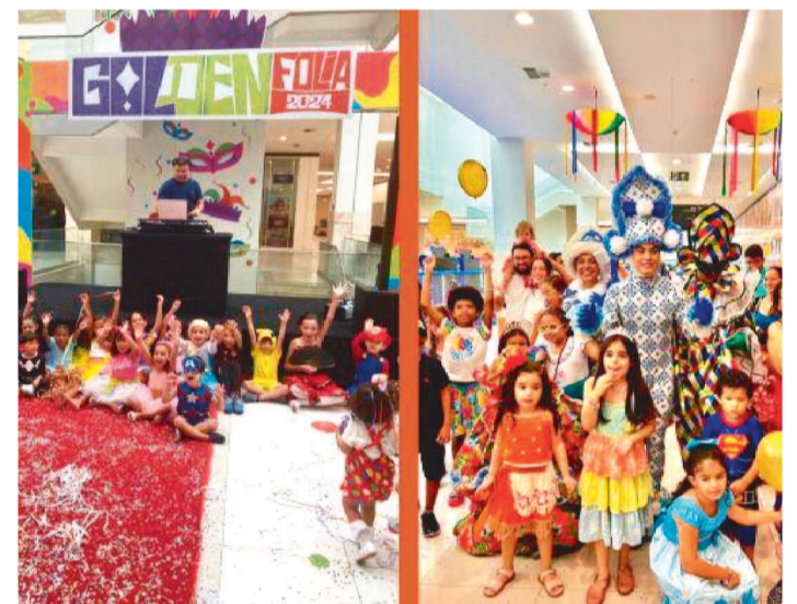
Feirinha de adoção e carnaval exclusivo para pets

A folia ainda não encerrou no Golden Shopping Calhau. Neste final de semana, o agito continua para a garotada no sábado (17) com o “Lavapratinhos”, a partir das 16h, evento ideal para quem não pôde curtir o Carnaval ou para quem deseja repetir a dose da grande folia que teve no empreendimento nos últimos dias. A animação ficará por conta de um pocket show com os Bolo-fofos.