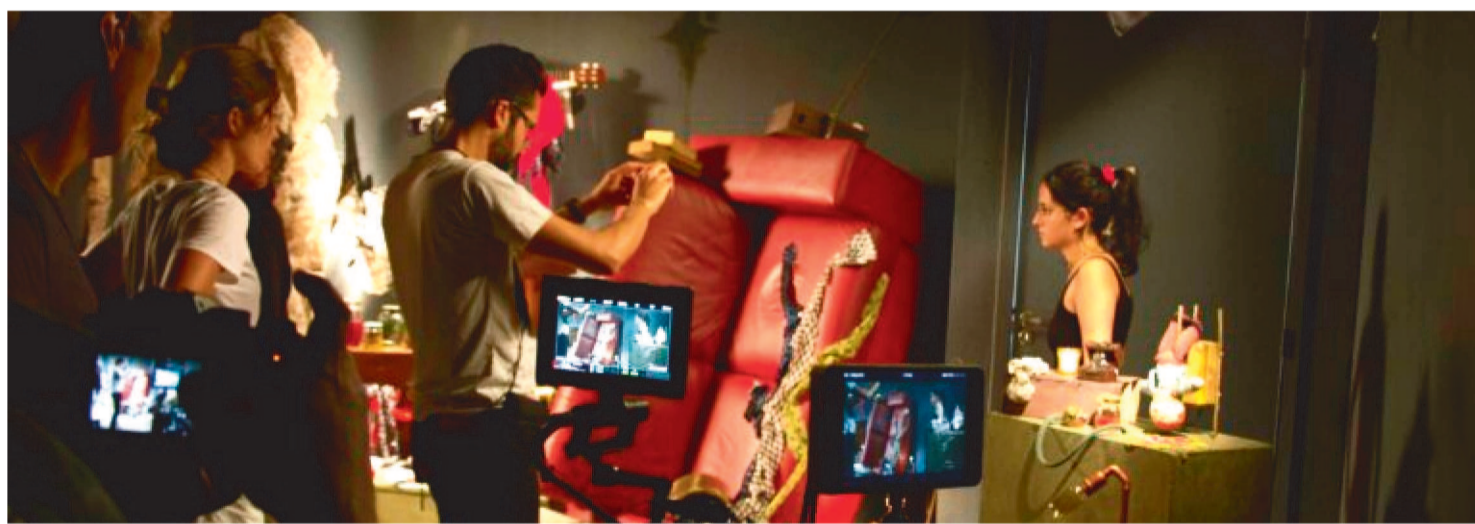
A FORMAÇÃO TERÁ DURAÇÃO DE 4 DIAS E SERÃO OFERTADAS 50 VAGAS, COM CERTIFICAÇÃO AOS ALUNOS QUE CONCLUÍREM O CURSO