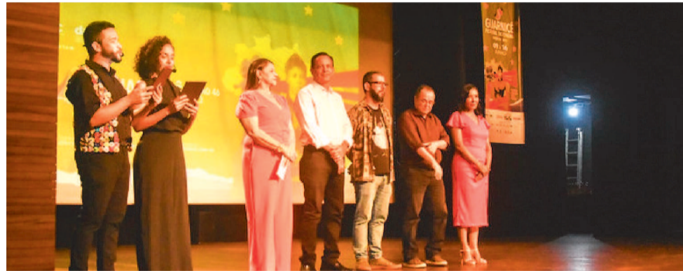
O FESTIVAL GUARNICÊ DE CINEMA É REALIZADO DESDE 1977 PELA UFMA

O melhor filme de longa-metragem nacional receberá um prêmio de R$20 mil, já o melhor curta nacional receberá de R$10 mil. As duas categorias