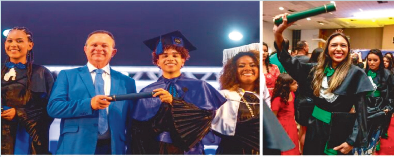
"Nós temos 34 lemas em funcionamento e vamos inaugurar mais 15 unidades, totalizando 49 lemas em todo o Maranhão. Isso vai garantir oportunidades para que mais jovens do nosso estado possam ter acesso a ensino e formação profissional de qualidade", assinalou o governador Carlos Brandão