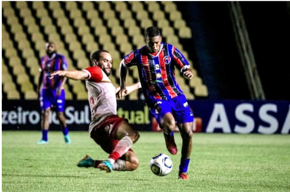
O MARANHÃO ATLÉTICO CONQUISTOU SUA PRIMEIRA VITÓRIA NA COPA DO NORDESTE

O Maranhão enfrentará o Treze-PB, às 19h, no estádio Nhozinho Santos, em São Luís, enquanto a Juazeirense