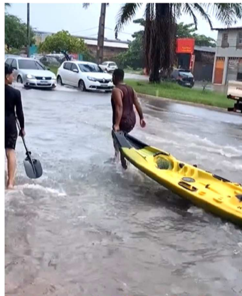
Morador de um condomínio em

ser afetadas pela intensidade da chuva. “O morador precisa ficar sempre alerta para qualquer risco. Minha família mora na área da Maiobinha e toda vez que chove fica um rio ali. É sempre um problema”, comentou.