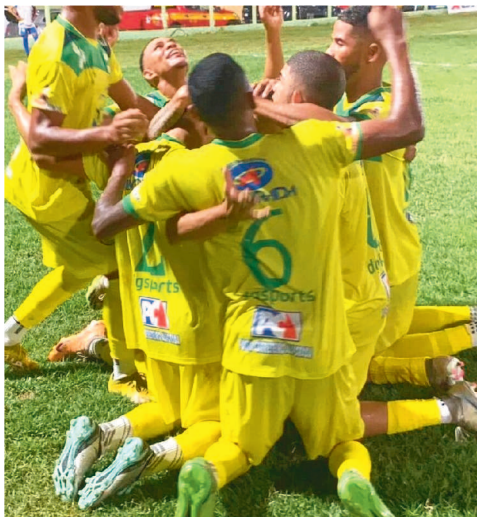
As duas partidas acontecem neste sábado (24), quando o Chapadinha recebe o Cordino, às 16h30, no Está-

O MAC está mais tranquilo, pois tem 22 pontos e é a única equipe invicta na competição. Com três pontos a frente do vice-líder, que é o Sampaio, uma vitória deixa a diferença maior, pois o Tricolor já jogou por esta rodada e empatou com o Pinheiro, na última quinta-feira (22), em 2 x 2.