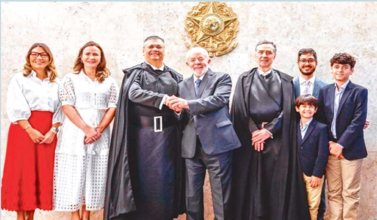
O presidente da República, Luiz Inácio Lula da Silva, com a primeira dama Janja, entre outras autoridades de todo o país, foram recebidos pelo presidente da Corte, Luís Roberto Barroso (na foto com familiares)