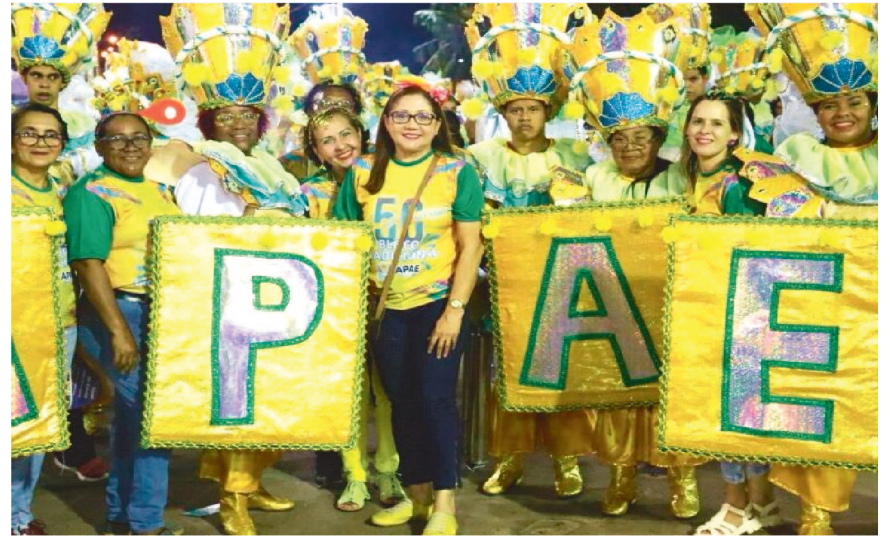
O Bloco Tradicional da APAE de São Luís é uma importante ferramenta de visibilidade e conscientização para uma sociedade mais justa e respeitosa para pessoas com deficiência.