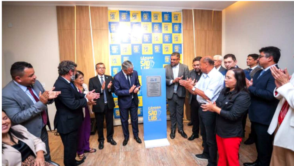
OS LOCAIS FACILITAM O ACESSO AOS SERVIÇOS ELEITORAIS E SOLUÇÃO DE CONFLITOS

Já o Centro de Mediação e Conciliação vai oferecer a oportunidade para