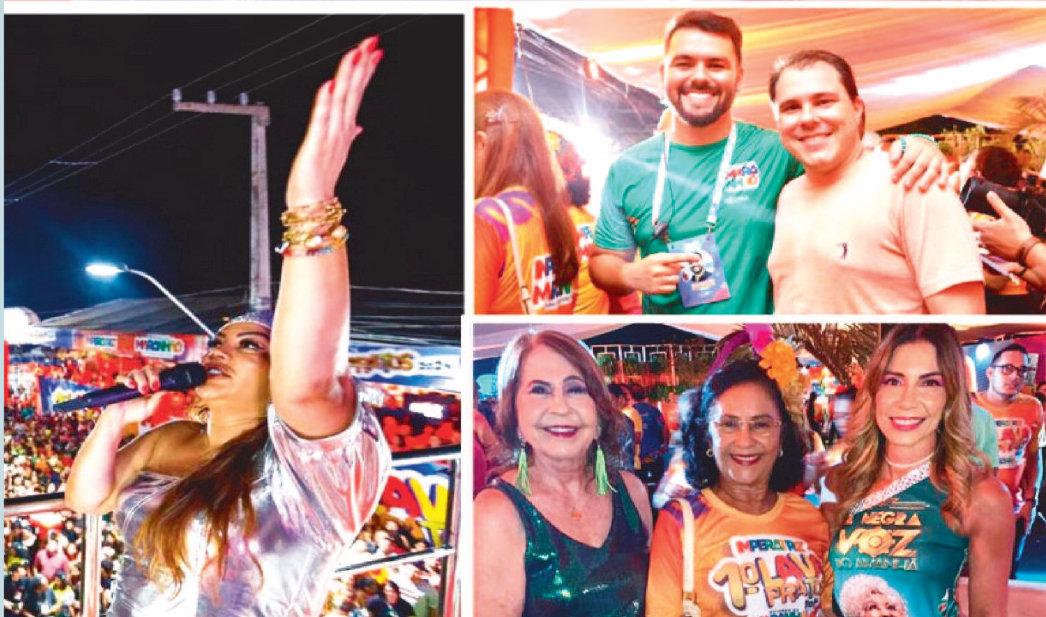
O governador Carlos Brandão esteve na cidade de Imperatriz, para acompanhar toda a programação. "A primeira noite de Lava-Pratos em Imperatriz foi muito bonita. Para isso, garantimos toda a estrutura de segurança e estrutura necessária para que as famílias possam se divertir com tranquilidade. Serão também dois dias de geração de emprego e renda para a população da cidade", ressaltou.