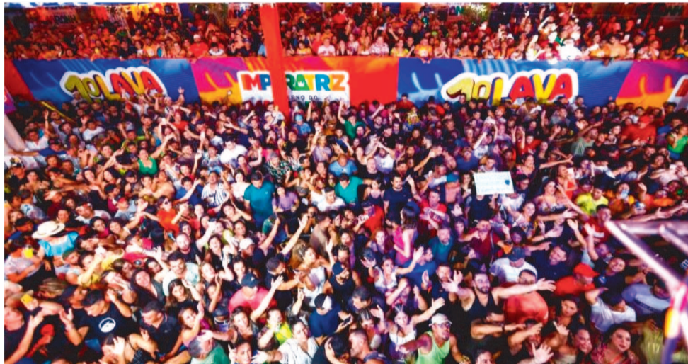
FORAM DOIS DIAS DE FESTA COM ARTISTAS LOCAIS E NACIONAIS NO CIRCUITO DA CIDADE

O governador Carlos Brandão esteve na cidade para acompanhar toda a programação. “Garantimos toda a estrutura de segurança e estrutura necessária para que as famílias possam se divertir com tranquilidade. Foram