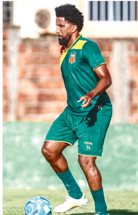
A equipe boliviana fez o último trei-

namento em São Luís na manhã dessa segunda-feira, no CT. À tarde, a delegação já embarcou para a missão no Acre.